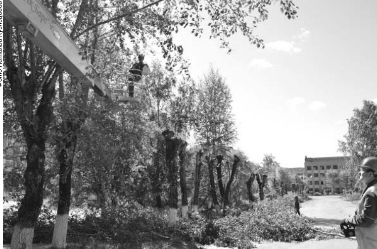
Порядок к Дню города уже наводят на улице Ленина.

В организации мероприятий по благоустройству городской территории администрация Александровского муниципального района тесно взаимодействует с Центром занятости населения и ООО «АДС». Совместными усилиями благоустроиваем город, видим проблемы территории и решаем их. Есть планы активного взаимодействия с Молодежным парламентом и предпринимательским сообществом при решении этих вопросов. Хочется, чтобы столь же высокую заинтересованность в благоустройстве города проявляла и администрация Александровского городского поселения.