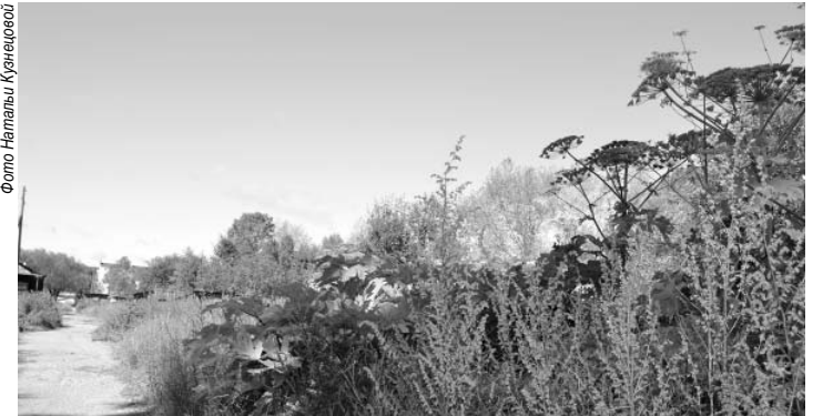
Борщевнику комфортно расти даже в центре города.

На сегодняшний день он по факту является сорной растительностью, так как исключен из реестра сельскохозяйственных культур, и в отношении лиц, допустивших заращение борщевиком земель сельхозназначения, оборот которых регулируется федеральным законом от 24.07.2002 № 101-ФЗ «Об обороте земель сельскохозяйственного назначения», для ведения сельхозпроизводства или осуществления иной связанной с сельхозпроизводством деятельности, принимаются меры в виде привлечения к административной ответственности по ст. 8.8, 8.7 КоАП РФ. Также выдаются предписания с установленным сроком исполнения, согласно законодательству РФ, по устранению путем проведения комплекса агротехнических мероприятий для дальнейшего использования в сельскохозяйственном производстве или иной связанной с сельхозпроизводством деятельности.