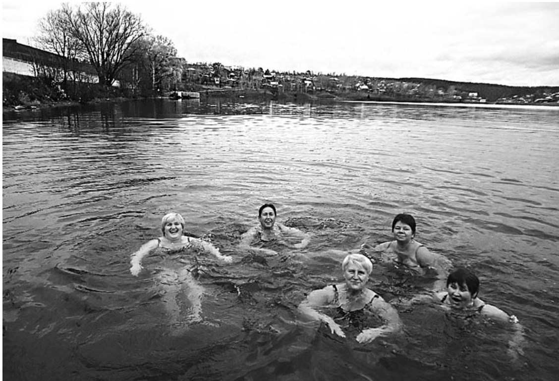
Поздняя осень. Как говорят женщины, когда выпадает снег – уже не до фотографий.

У каждой из женщин своя мотивация. Но на мое «Зачем?» от всех услышала: «Бодрит. Когда купаешься – появляется легкость, много энергии. Усталость снимает как рукой». К слову, есть мнение (его высказал один советский врач), что закаливание самым лучшим образом сказывается на внешности. Практически все «моржи» могут