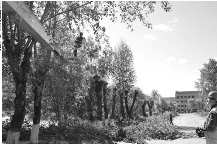
Порядок к Дню города уже наводят на улице Ленина.

В организации мероприятий по благоустройству городской территории администрация Александровского муниципального района тесно взаимодействует с Центром занятости населения и ООО «АДС». Совместными усилиями благоустраиваем город, видим проблемы территории и решаем их. Есть планы активного взаимодействия с Молодежным парламентом и предпринимательским сообществом при решении этих вопросов. Хочется, чтобы столь же высокую заинтересованность в благоустройстве города проявляла и администрация Александровского городского поселения.