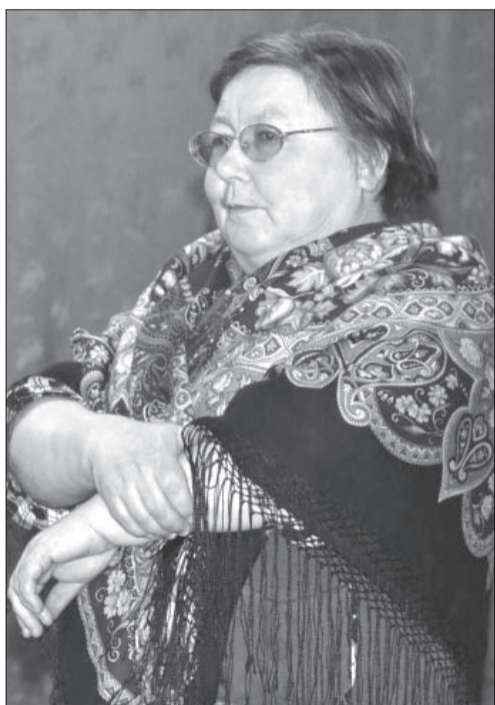
ФОТО: СВЕТЛАНА БАЯНДИНА, «ПН».

Глава Валентина Мизева через 30 минут уходит из зала. Потом, правда, возвращается. Но когда ее снова «заваливают» претензиями, уходит. ФОТО: СВЕТЛАНА БАЯНДИНА, «ПН».