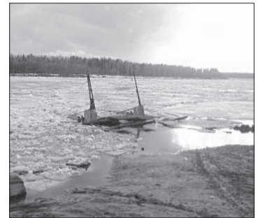
Катер, который погружен в воду, по словам жителей поселка Кебраты, принадлежит администрации, она им не пользуется уже как года два.