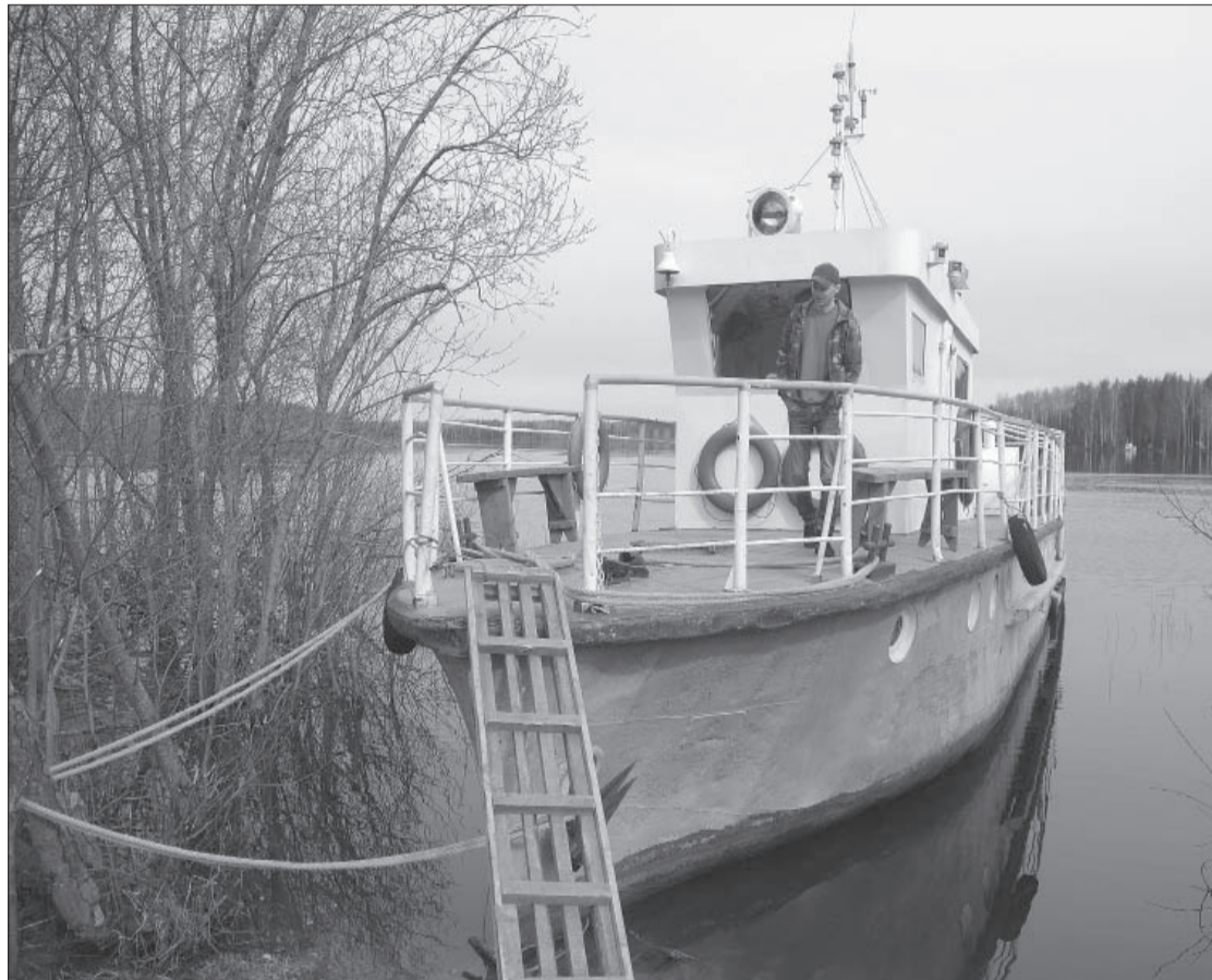
В десять часов утра 19 мая катер стоит у берега Камы. Капитана на месте нет. Он появится только вечером.

ПРОБЛЕМА. В Гайнском районе не могут наладить переправу