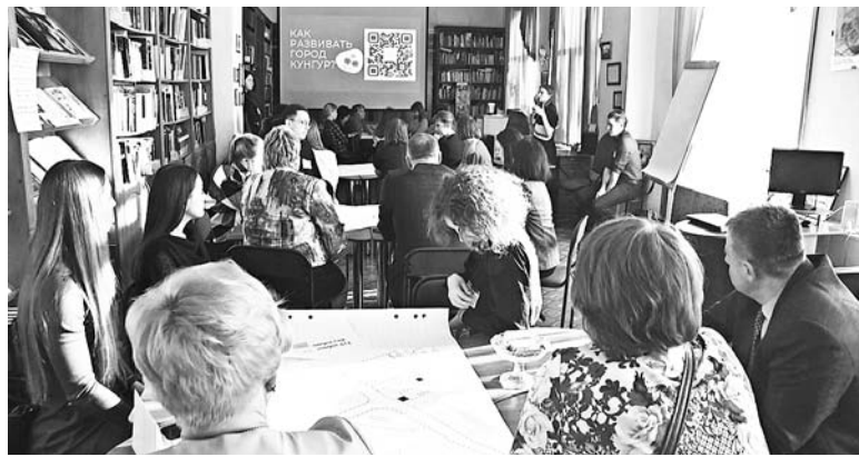
Читальный зал центральной библиотеки был полон неравнодушных к судьбе города кунгуряков

←1 Интересно то, что, несмотря на новые лица, новый состав групп, цели и задачи мероприятия были успешно достигнуты. Что обсуждали на второй встрече? Жители города, представители администрации, бизнеса, социальных направлений анализировали функциональное зонирование территории будущего проекта по развитию города. Оставить ли городскую площадь без изменений или же наполнить её новыми площадками, малыми архитектурными формами. Как активировать территорию Ленинского сквера, которая сейчас почти никак не используется? Всё это действительно важные вопросы для перспективного развития городских пространств. Центральная часть города - это место обитания не только коренных жителей, но и визитная карточка города для туристов. Каким мы хотим видеть Кунгур будущего - это и есть главный вопрос, который мы пытаемся решить уже на вторых публич-