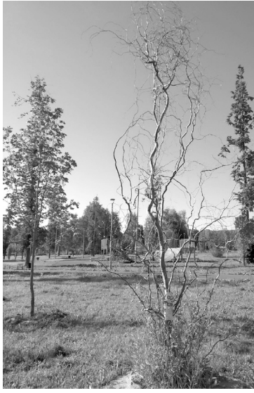
Икебана из ивы извилистой