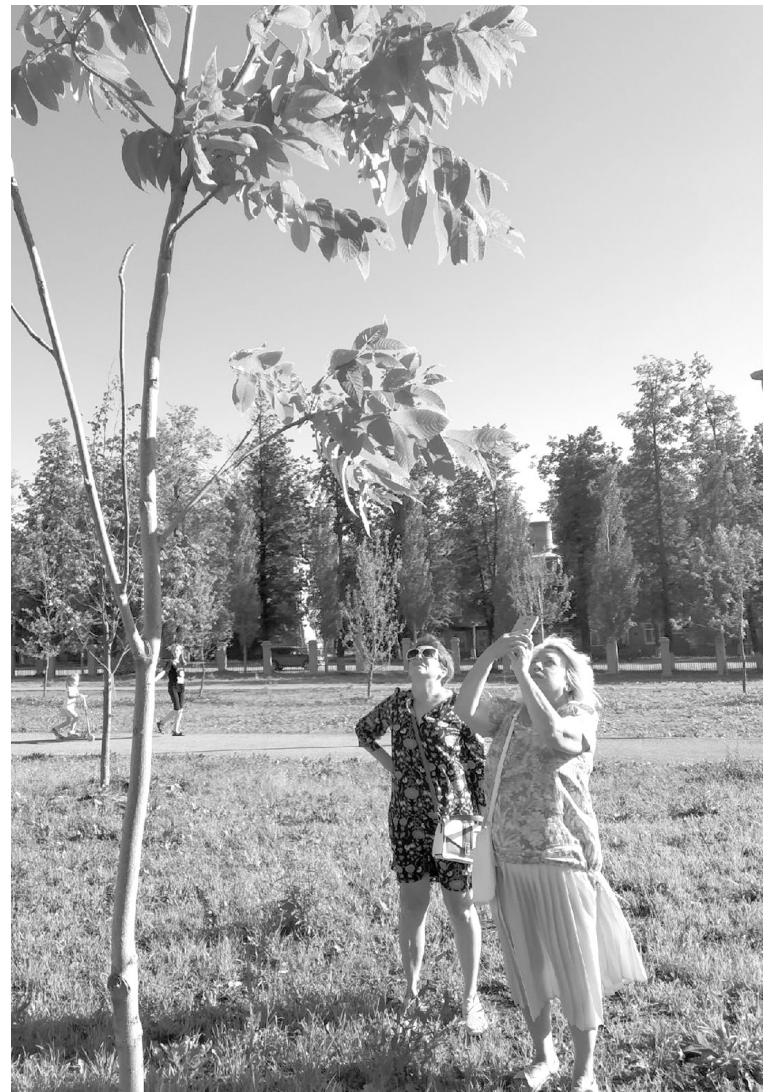
Что за чудо – маньчжурский орех

Случилось и чудо открытия – мы увидели дерево с необычными крупными листьями,