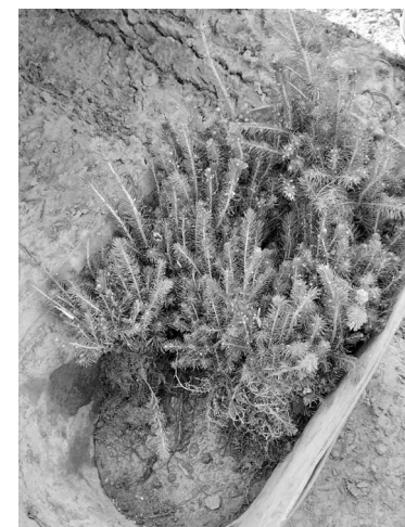
Этим ёлочкам три года. До метровой высоты им расти ещё девять лет

лесничества, не все, кто рубит лес, обязаны высадить на месте порубки новые деревья. Например, те, кто взял участки на аукционе, уже заплатили государству за лесовосстановление, и на эти средства деревья высаживают госслужащие – лесничие. Не обязаны восстанавливать лес и граждане, которые получают его для личных нужд: в стоимость древесины также включено лесовосстановление. Вот на таких участках и проводит Березниковское лесничество посадки.