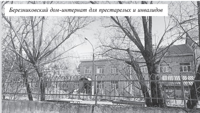
Березниковский дом-интернат для престарелых и инвалидов

Конфликт между руководством учреждения и некоторыми сотрудниками березниковского филиала «Соликамский дом-интернат для престарелых и инвалидов», кажется, удаётся погасить.