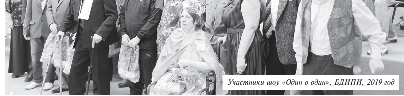
Участники шоу «Один в один», БДИПИ, 2019 год

«Её вообще здесь ничего не интересует. Она никаких собраний не собирает, о готовящихся проверках не сообщает, есть комиссия, нет ко-