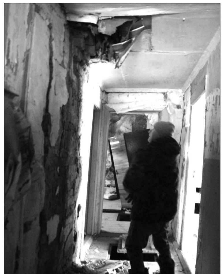
Соседняя муниципальная квартира пугает разрушениями: вот-вот обвалится потолочное перекрытие.