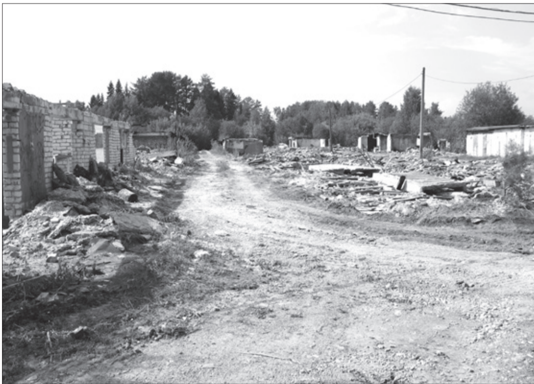
☑ Вместо гаражных кооперативов недалеко от базы отдыха «Дедюха» теперь пустырь.