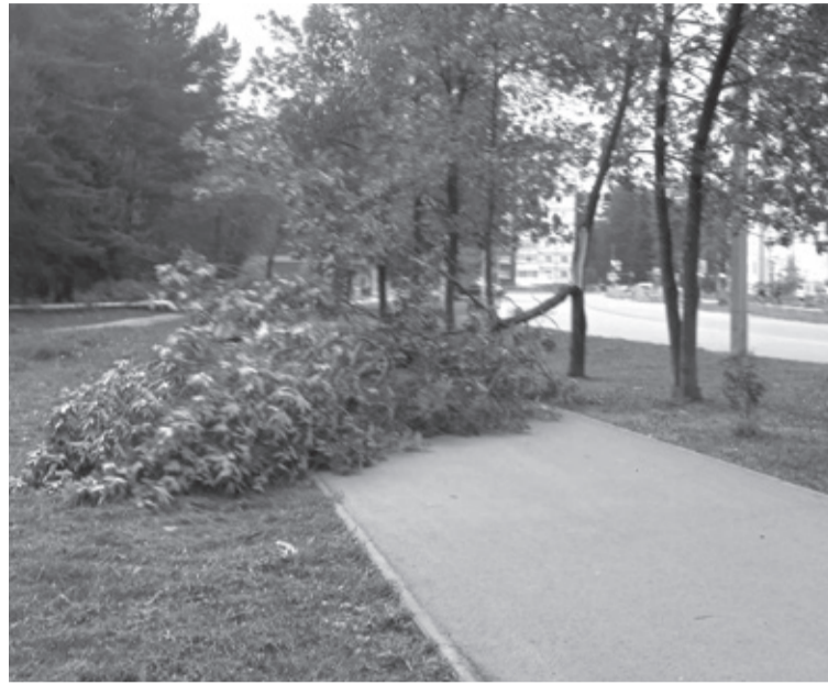
📍 От сильного ветра сломалось дерево у тротуара по ул. Советской.