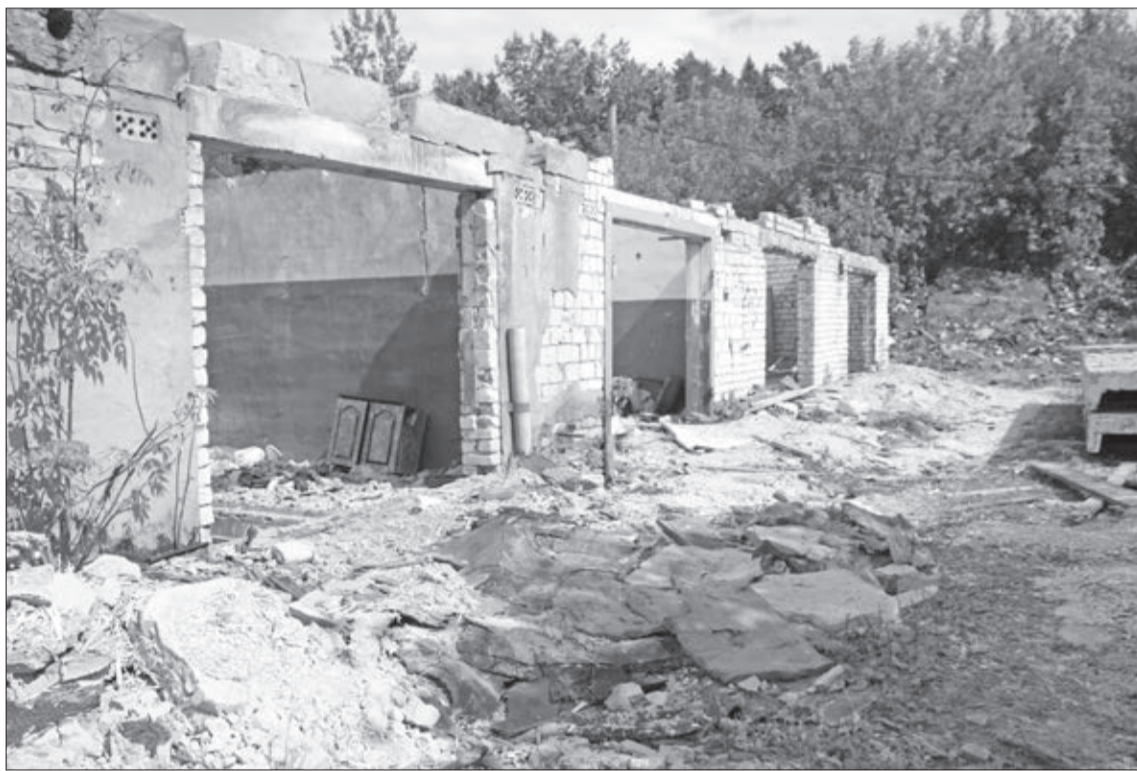
📷 Гаражи в районе бывшего ДСК в Добрянке начали сносить без ведома владельцев в августе прошлого года.

– После этого дело сдвинулось с мёртвой точки, а ведь сначала даже заявления не у всех принимали, просили