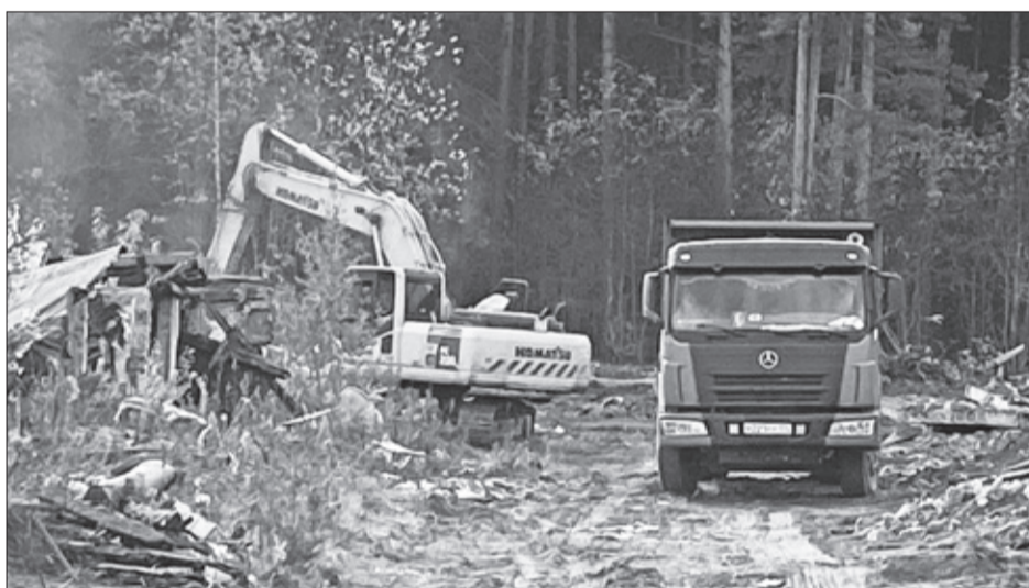
Снос боксов продолжается уже более трёх месяцев, несмотря на проверку полиции.

На основании поступивших заявлений от собственников некоторых гаражных боксов было возбуждено уголовное дело по ч. 1 ст. 167 УК РФ «Умыш-