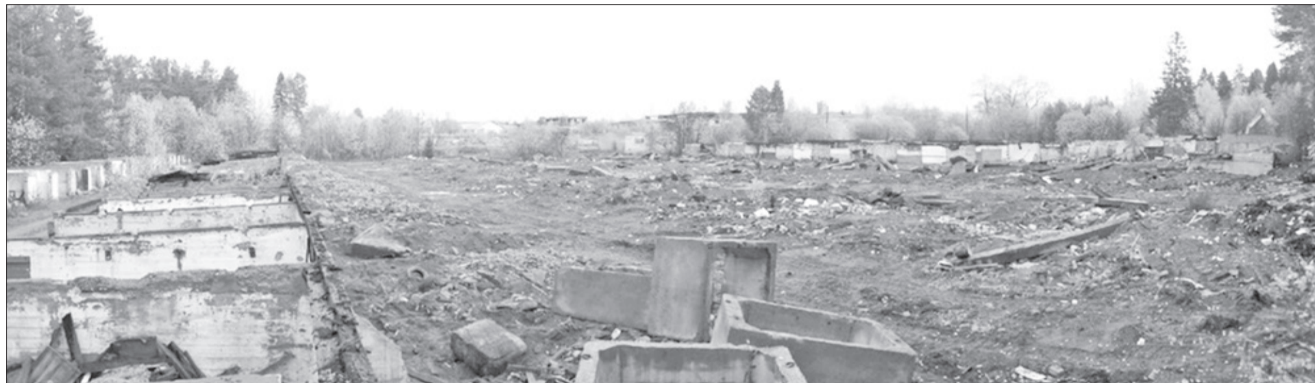
Там, где раньше был целый «город» гаражей, сейчас – лишь обломки строений.