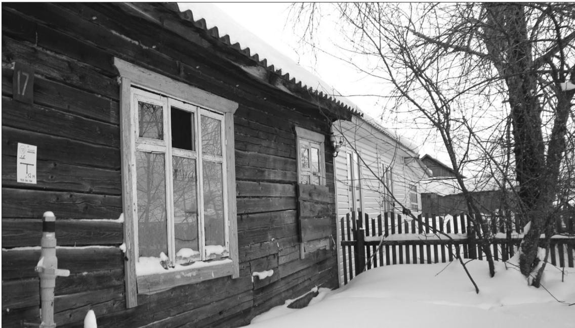
В «нехорошей квартире» соседи заколотили окна, повесили замок, чтобы здесь не собирались подозрительные компании.