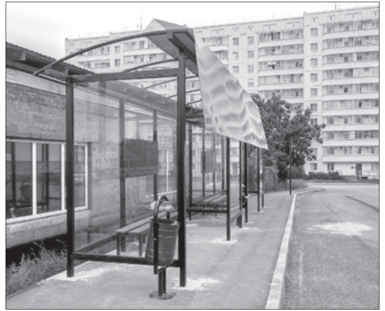
📍 На остановке за Дворцом культуры сорвало крышу.