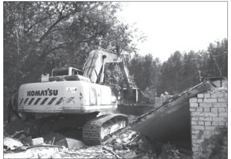
📍 Более 25 гаражей, расположенных недалеко от базы отдыха «Дедюха», уже выкуплены и снесены.