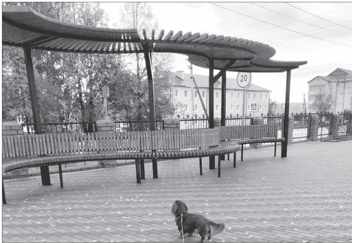
Пергола на обновленной площадке у ДК п.Октябрьский. Участники встречи считают, что в приемке объектов благоустройства должны принимать участие и члены общественного совета.

По мнению спикера, хоть совет общественный и его решения носят рекомендательный характер, он может запрашивать информацию по всем вопросам, заслушивать чиновников любой сферы.