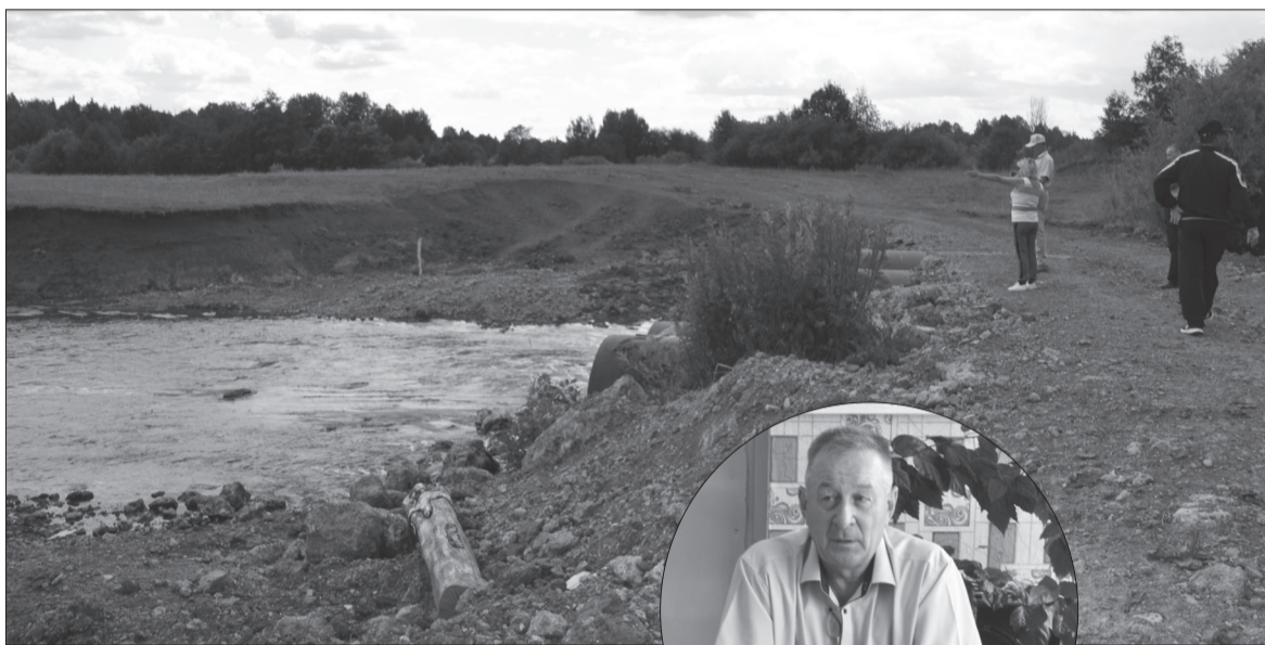
Глава осматривает переправу на Васильевку. /ФОТО:

– Вот если бы из водокачки вывести кран с очищенной водой, как в Тюинске, чтобы