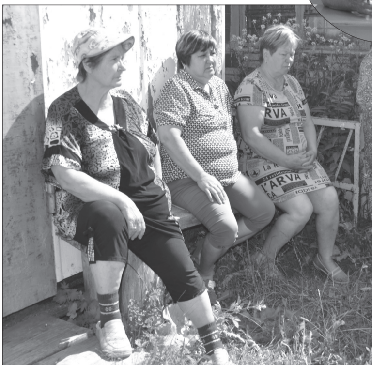
Люди в Новопетровке собрались у магазина.