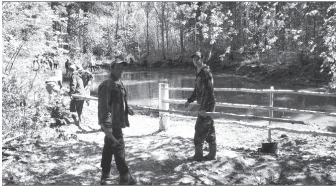
Жители деревни Бикбай чистят любимое озеро сообща.

Изначально деревня называлась Крымсараево, а основателем ее значился Бикбай Крымсараев. Местные историки считают, что все населенные пункты по реке Ирени пошли именно от них.