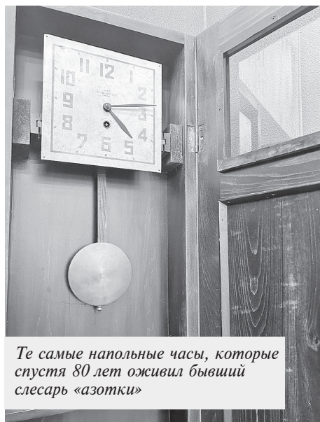
Те самые напольные часы, которые спустя 80 лет оживил бывший слесарь «азотки»

— Они, правда, будто умерли. Приложил к ним руки — холодом вст. Не потому что металл, нет.