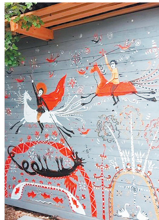
Роспись сарая в мезенском стиле кисти Алексея Афонасьева