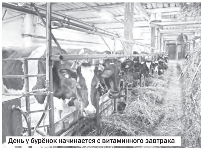
День у бурёнок начинается с витаминного завтрака