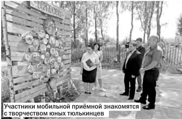
Участники мобильной приёмной знакомятся с творчеством юных тюлькинцев