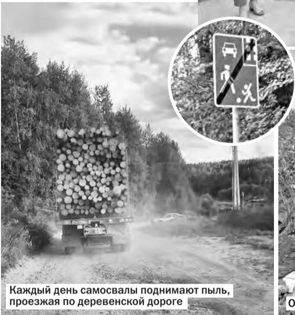
Каждый день самосвалы поднимают пыль, проезжая по деревенской дороге