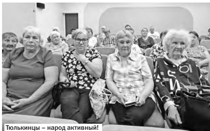
Тюлькинцы – народ активный!