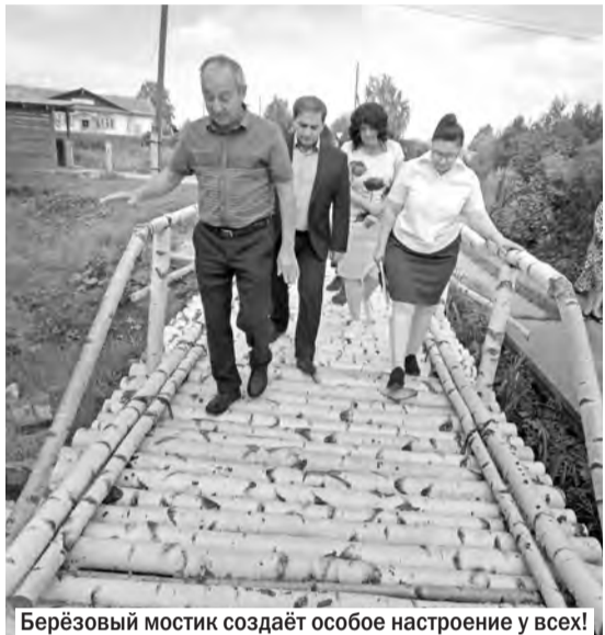
Берёзовый мостик создаёт особое настроение у всех!

Мобильная приёмная главы Соликамского городского округа, прошедшая в п. Тюлькино, убедительно доказала результативность во взаимоотношениях населения и власти. На встречу пришло много неравнодушных жителей посёлка, зал Тюлькинского Дома культуры был практически полным.