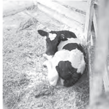
Милашку поместили под специальную лампу

Дальняя дорога в морозное февральское утро никак не могла омрачить моего настроения. Еду в Толстик. А это значит, что познакомлюсь с новыми людьми, выбравшими деревню на ПМЖ.