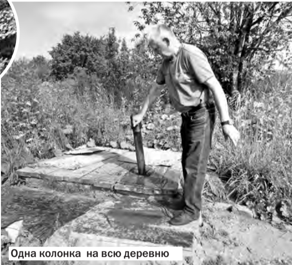
Одна колонка на всю деревню