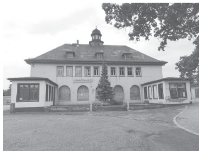
Между этими снимками ровно 73 года.