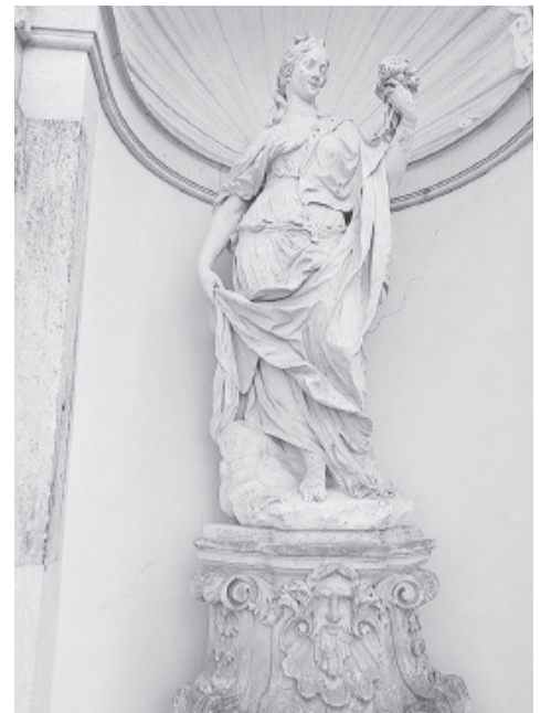
Одна из многочисленных скульптур Цвингера