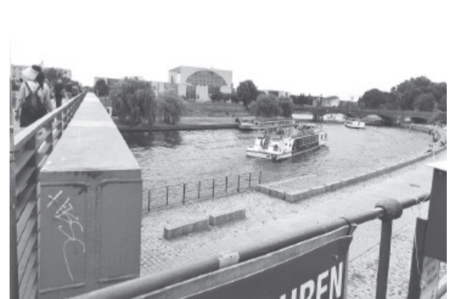
И плывут, плывут по Шпрее пароходы, пароходы...