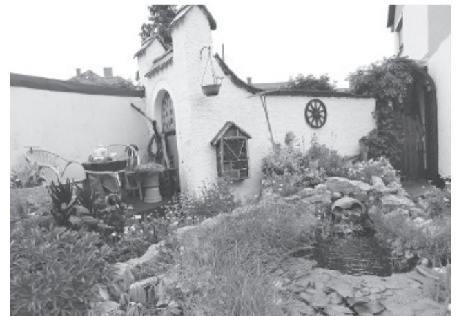
Вот такая красота!