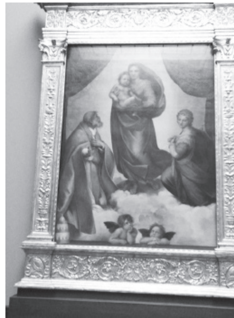
Вот она, Сикстинская мадонна!

Ну нет, так нет, тащусь в отель. Это малюсенькая, но очень уютная каюта в прищвартованном к берегу пароходике. Бросив чемодан, сразу в центр, в знаменитый Цвингер. Этот архитектурный комплекс знаменит с детства: у нас дома был такой альбом. Надо сказать, папа мой очень