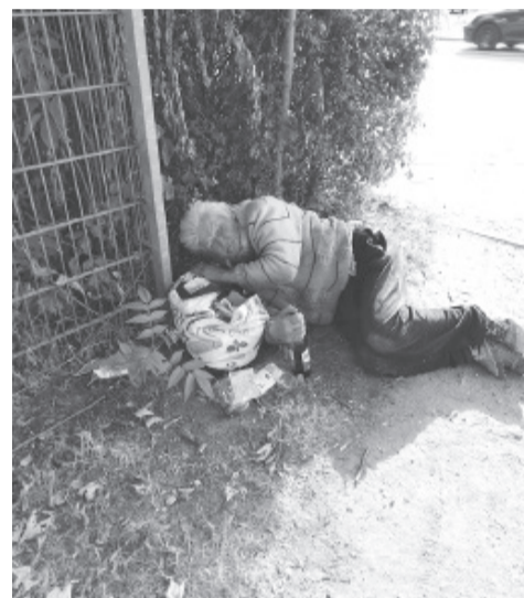
И у них бывает такое!