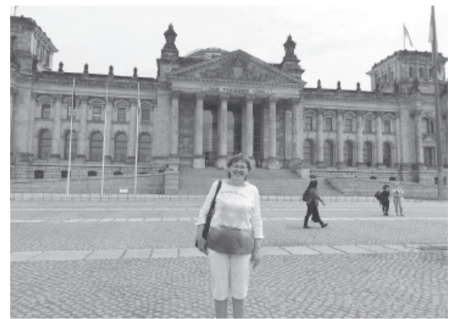
Дошла до Рейхстага! Фото: Галина Кукла. «НЖ»