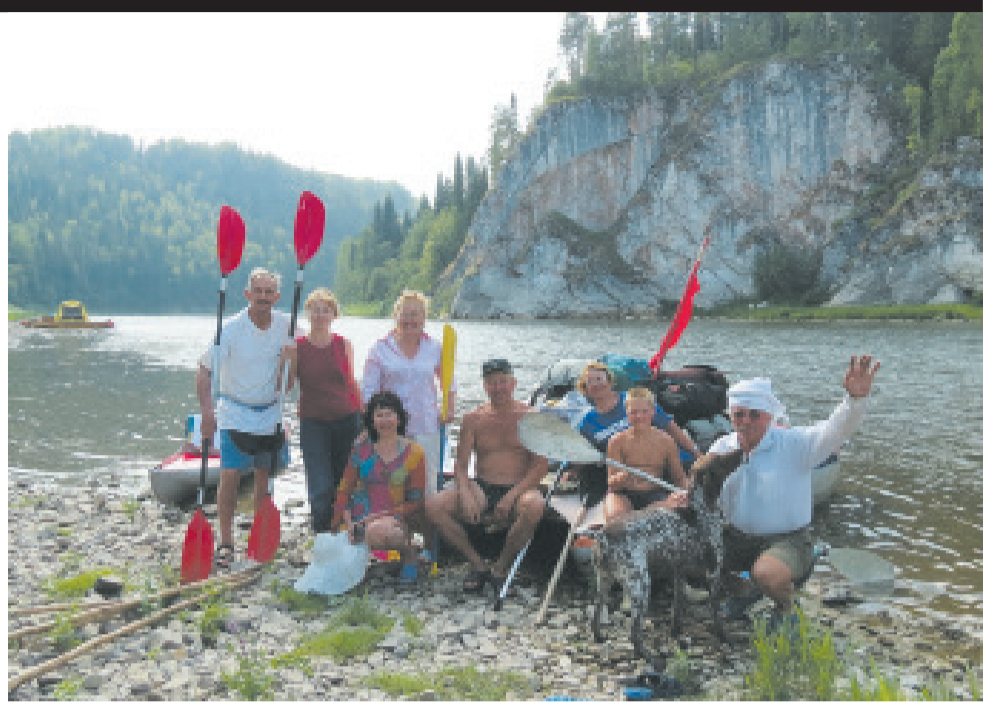
Команда молодости нашей...

Утром провожаем заезжих друзей на моторке в Чусовой, сами отправляемся дальше. Снова бесподобные пейзажи, скалы, встающие одна за другой. Например, скала Четыре брата напоминает нам профили Маркса, Энгельса и Ленина, как было принято изображать их раньше. На ходу придумываем, кто может стать четвертым. Гребём изо всех сил. И только сегодня кормчий решает заметить: «Разве вы гребёте? Вы просто макаете вёсла в воду». Подстёгнутые таким заявлением, удваиваем старания. По пути останавливаемся у причудливых творений природы. Забираемся под каменную арку, влезаем на камень Дыроватый. Что удивительно, огромное отверстие на вершине напоминает контур карты Пермского края. Когда останавливаемся на ночёвку в опять же отличном местечке, вождь ведёт нас к новым вершинам. Вернее, глубинам: предлагает осмотреть пещеру Чудесница. «Там всё равно темно, чтобы завтра не потерять времени, можно посе-