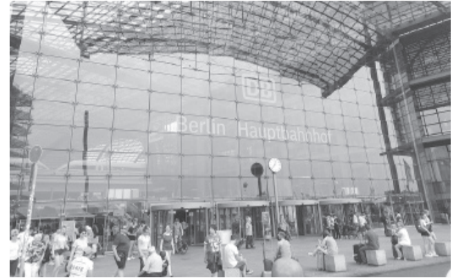
Столичный вокзал.