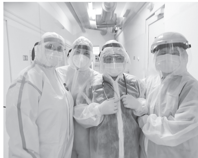
Неприменно найду возможность сфотографировать прекрасные лица наших медиков.

А ещё для нас организовывали четырёхразовое питание. Хочу заметить, несмотря на то, что первоначально ковид у меня подтвердился (второй анализ, через 9 дней, был уже отрицательным), я почти не