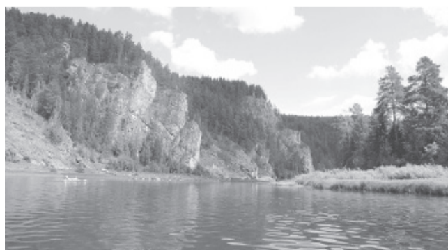
Чусовую жилкой золотую называет издавна народ...