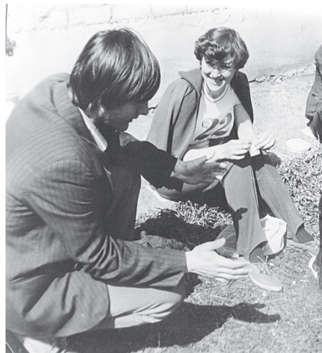
Делегат на Олимпиаду весьма подходящий! В большинстве соревнований в то время всегда принимала участие. В данном случае под номером 22.

но вглядываюсь в кадры того времени, надеясь увидеть и себя. Помню, тогда страшно хотелось узнать, куда делся улетевший Мишка. На другой день, уже перед отъездом