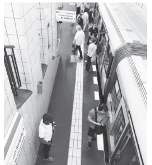
В метро Лейпцига

любил искусство и выписывал подобные альбомы по почте. Он мог интересно рассказать о любой картине любого художника, сейчас предпологаю, что многие истории сюжетов папа придумывал сам. И вот я воочию вижу эту крепость, эти прекрасные фонтаны, эти неповторимые скульптуры, из которых ни одна не похожа на другую. Вот самая известная – скульптура Геракла, поддерживающего небо. Картинная галерея, к сожалению, закрыта: понедельник – выходной день. Не беда – у меня ещё есть завтра!