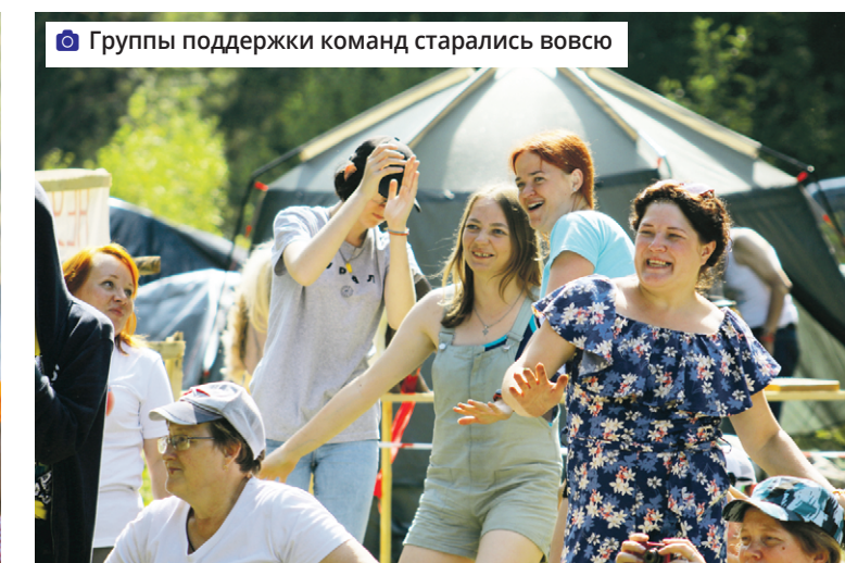
Группы поддержки команд старались вовсю

Суббота была просто сумасшедшей! Мероприятия, начавшись с утренней зарядки, приобрели творческий, а потом и спортивный «окрас». Поучаствовать во всех не смогли даже самые активные, ведь это было практически невозможно: состязания шли порой одновременно в разных концах поляны.