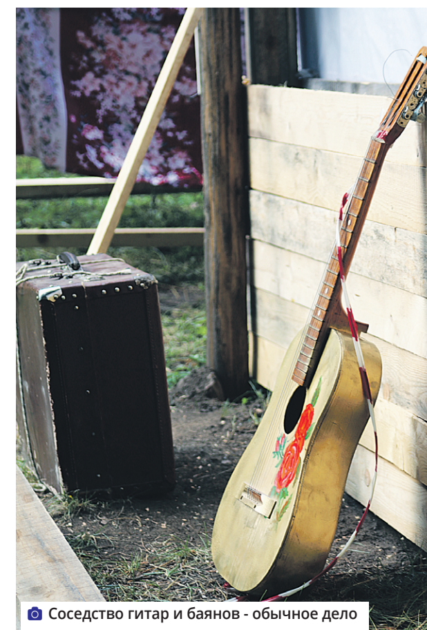
Соседство гитар и баянов - обычное дело

Организаторы фестиваля - редакция «Искры», ЛКДЦ, клуб «Родник». В этом году в конкурсах участвовали около 200 человек из разных регионов России и из Беларуси