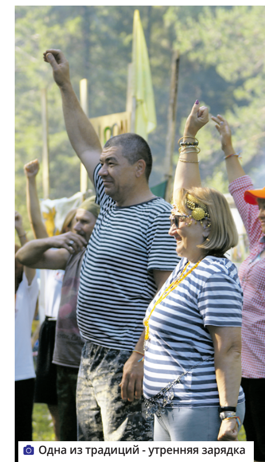
Одна из традиций - утренняя зарядка