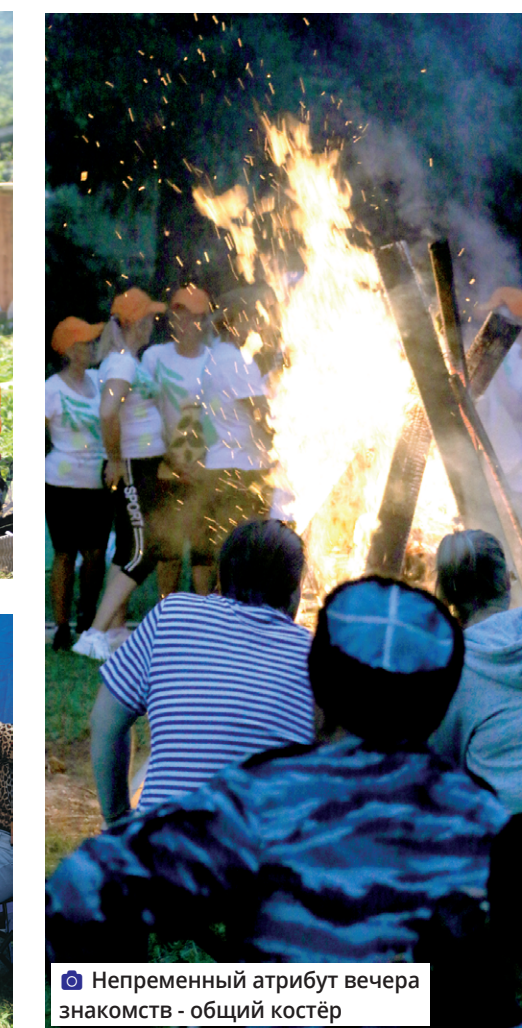
Непременный атрибут вечера знакомств - общий костёр