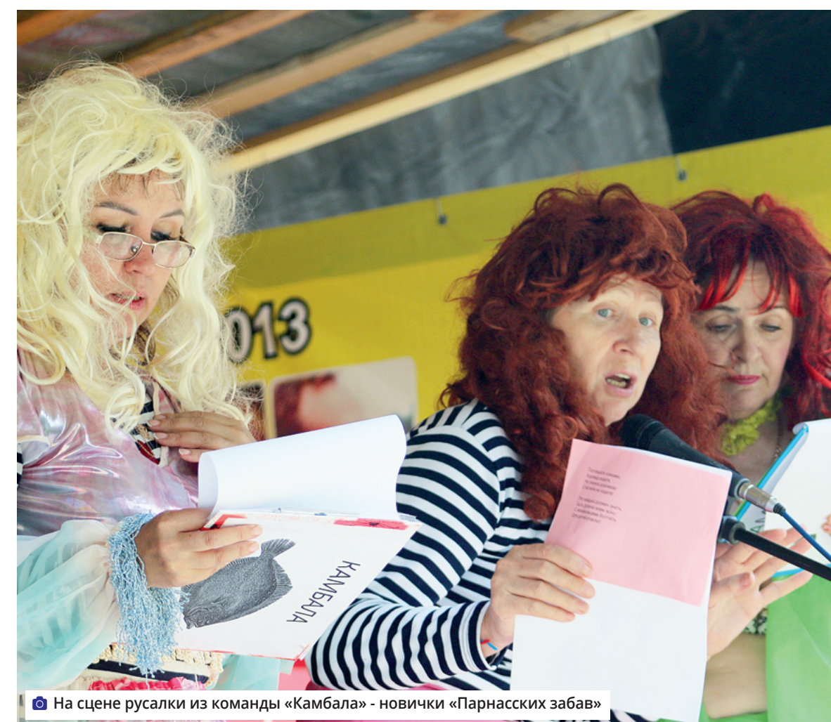
На сцене русалки из команды «Камбала» - новички «Парнасских забав»

Организаторы фестиваля - редакция «Искры», ЛКДЦ, клуб «Родник». В этом году в конкурсах участвовали около 200 человек из разных регионов России и из Беларуси