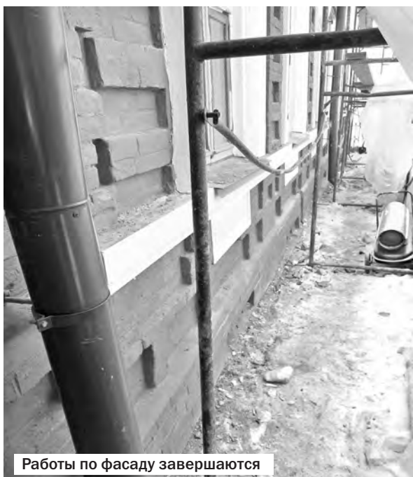
Работы по фасаду завершаются