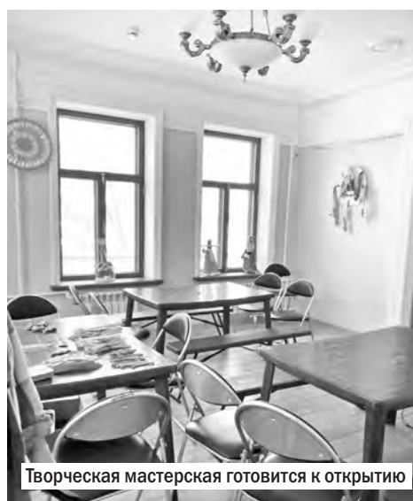
Творческая мастерская готовится к открытию