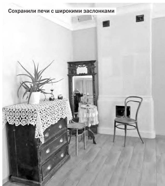
Сохранили печи с широкими заслонками

Начало 2000-х было для музея трагическим, произошло три пожара, в которых, в том числе, серьёзно пострадали амбары. Пожар 2005 года практически уничтожил контору сользавода, где располагались администра-