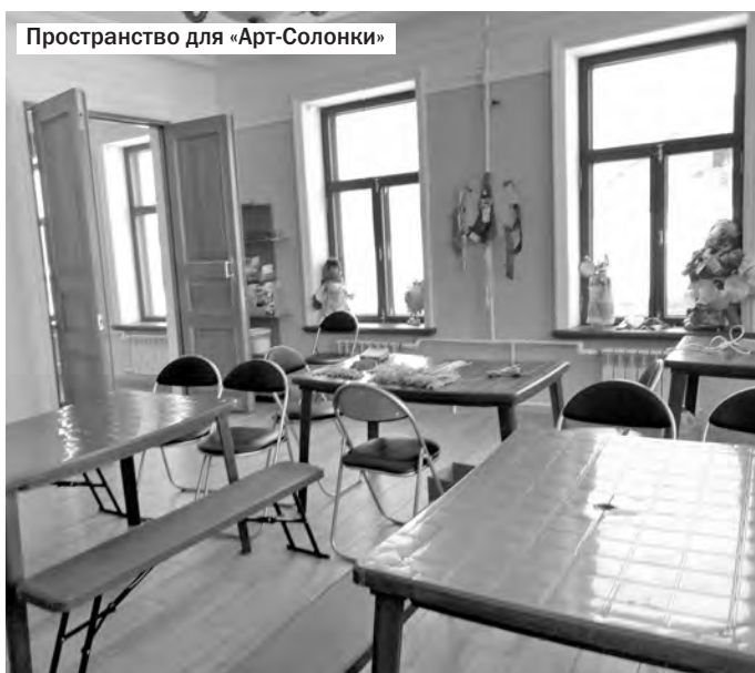
Пространство для «Арт-Солонки»

Несмотря на ремонтно-реставрационные работы, музей соли принимает гостей и проводит экскурсии в штатном режиме