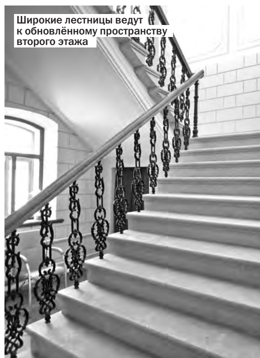
Широкие лестницы ведут к обновлённому пространству второго этажа