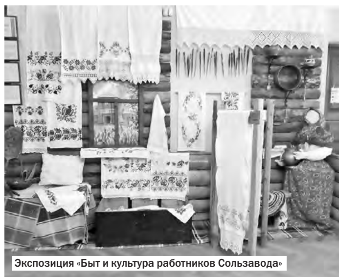
Экспозиция «Быт и культура работников Сользавода»