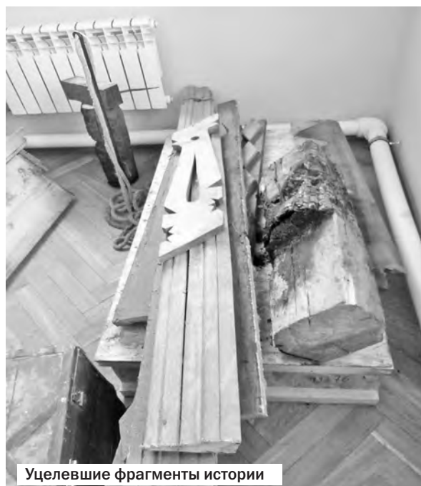
Уцелевшие фрагменты истории