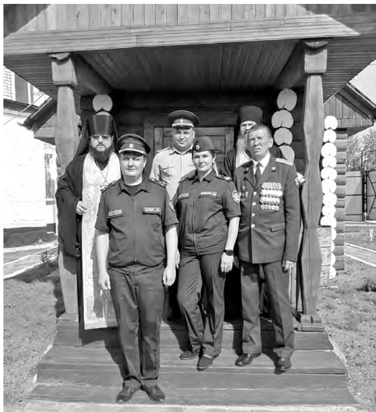
На крыльце нового храма сотрудники ГУФСИН и священнослужители

Дни памяти: 14 марта (1 марта по ст. ст.) и в Соборе новомучеников и исповедников Церкви Русской.