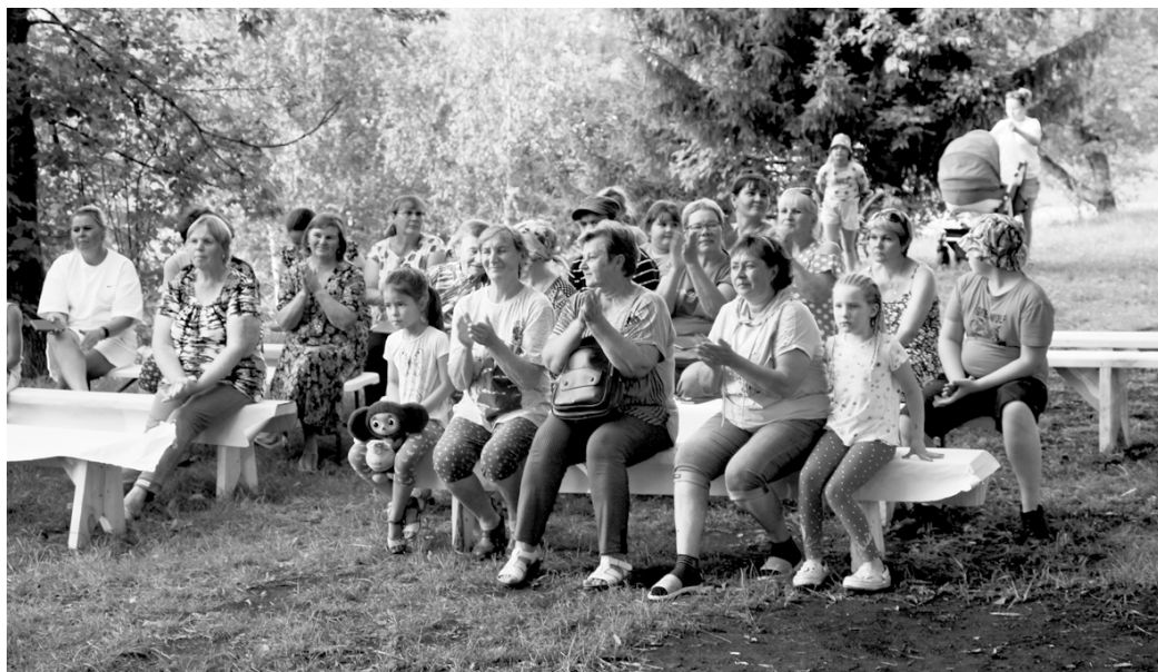
На концерты автоклуба зрители всегда ходят с удовольствием