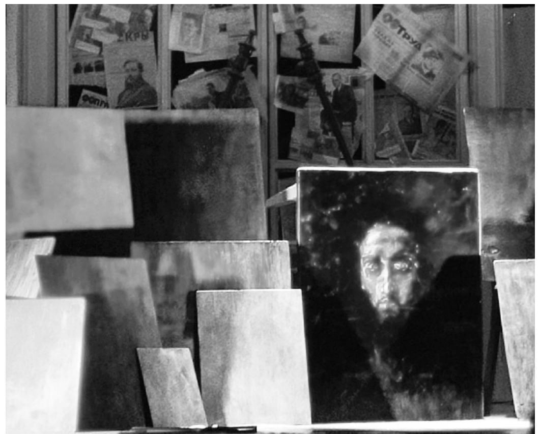
Зловещий портрет ростовщика для постановки не рисовали, а использовали картину Михаила Врубеля «Голова Христа»