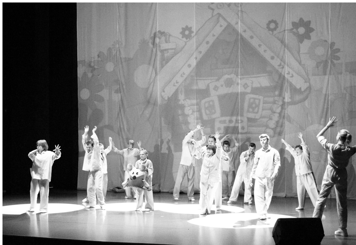
Первый спектакль кунгурского инклюзивного театра поставлен по сказке «Теремок»

Сказки называются подушечными, потому что дети танцуют и играют с подушечками в руках: у кого-то это просто