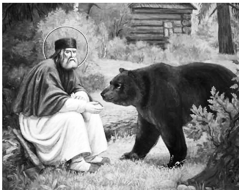
Преподобный Серафим Саровский - великий подвижник Русской церкви

Существование сельского католического храма на отдалённой северной территории само по себе необычно. Во всём Пермском крае католических церквей насчитывается всего три. Это храм Непорочного Зачатия Пресвятой Девы Марии (Пермь), храм Пресвятой Богородицы - Царицы мира (Березники) и храм Фатимской Божией Матери в посёлке Рябинино. Население небольшого посёлка составляет около 2,5 тысяч человек, из них 50% этнические немцы, 30% русские, также проживают украинцы, финны, поляки, эстонцы, татары и башкиры.