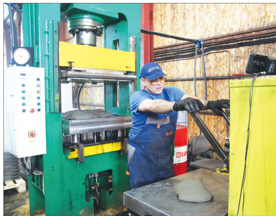
В специальном смесителе (справа) готовят полимерно-песчаную массу для тротуарной плитки. Готовое «тесто» укладывается в пресс (слева).

Своими глазами. Добрянцы побывали на экскурсии в экотехнопарке Прикамья по сбору и переработке вторичного сырья