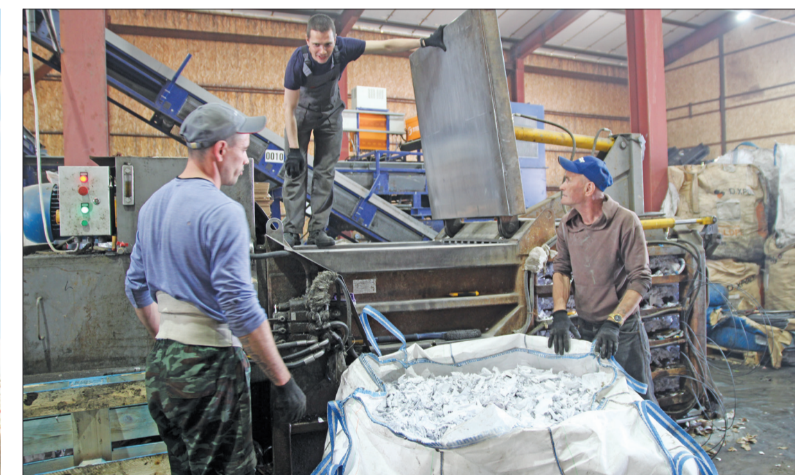
Макулатуру здесь тоже обрабатывают: сейчас измельчённая бумага отправится в пресс.