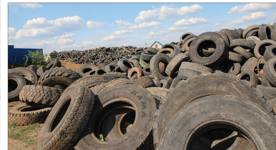
Из старых автопокрышек на предприятии «варят» розжиг для печей.