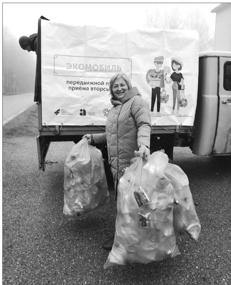
11 ноября раздельные отходы принесли 59 жителей города. Всего было собрано 253,1 кг вторсырья.

В целом в Прикамье планомерно внедряется система раздельного сбора мусора. Ранее губернатор Дмитрий Махонин отмечал, что перед краевыми властями стоит задача сделать сортировку отходов привычной для жителей. По его словам, вторичная переработка мусора полезна не только для сохранения природы, но и для развития