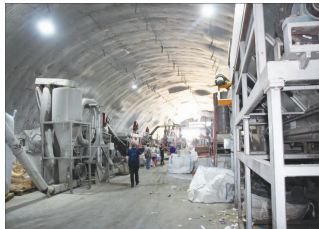
В огромном ангаре – линия по промывке пластиковых бутылок. Здесь же идёт просушка, измельчение, просеивание на вибросите, оптическая сортировка.