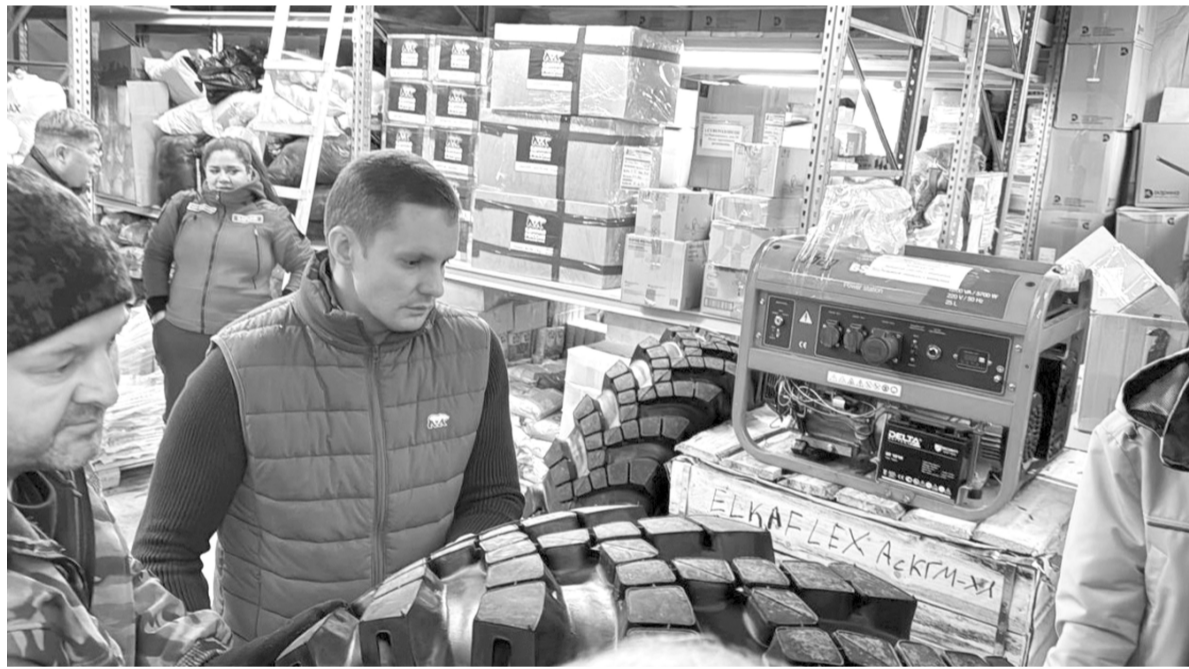
Общий объем отправленного груза составил 8,5 тонн

Из Пермского края в зону проведения СВО и подшефный Северодонецк было отправлено два гуманитарных конвоя. Груз подготовили представители регионального отделения партии «Единая Россия» совместно с «Гуманитарным центром Прикамья» и «Единым центром поддержки», а также Пермский региональный общественный фонд «Катюша».