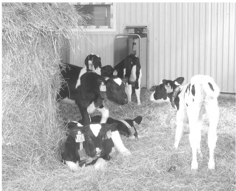
Эти малыши первыми заселились в свой детский сад-ясли