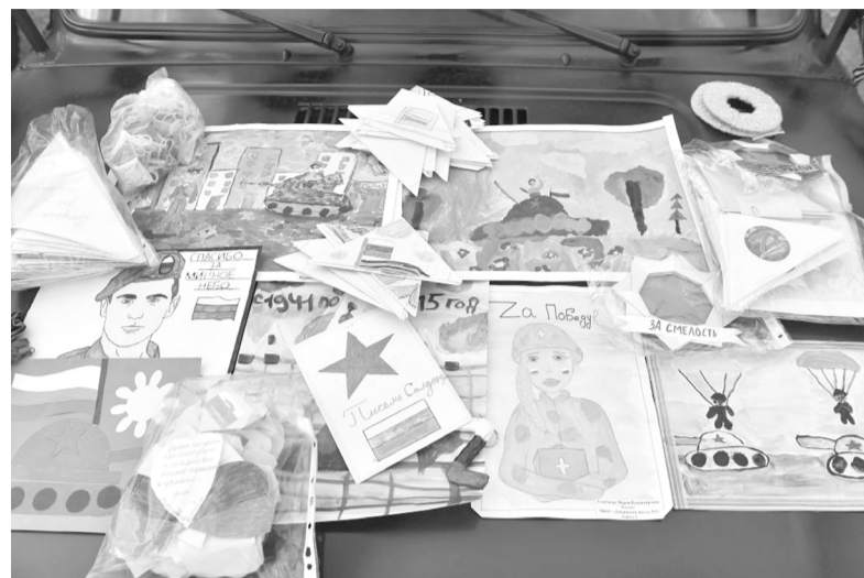
В России этот праздник отмечается ежегодно 9 декабря

Для участия в акции можно нарисовать открытку, написать письмо и поздравить воинов с Днем Героев Отечества и другими знаменательными датами. Письма будут доставлены и вручены участникам специаль-