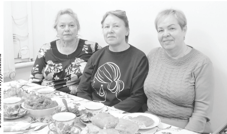
Встреча прошла за чашечкой чая и вкусными пирогами