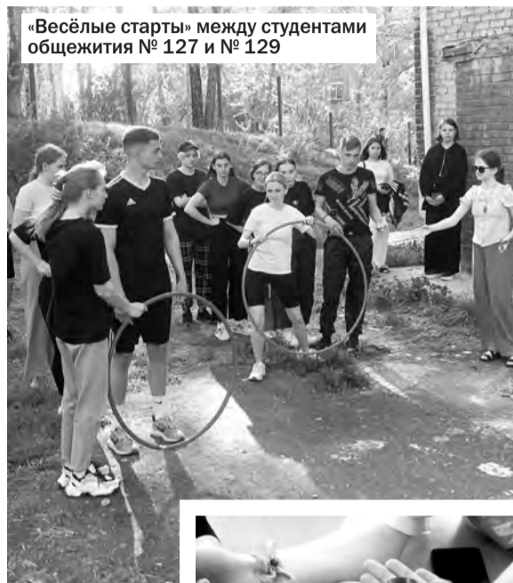
«Весёлые старты» между студентами общежития № 127 и № 129