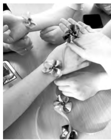
Мастер-класс «Незабудка» в рамках акции к Международному дню пропавших детей

сочиняет песни и по итогам муниципальной «Студвесны-2022» стала лауреатом II степени.