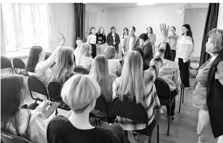
Студсовет на встрече с «общажатами»