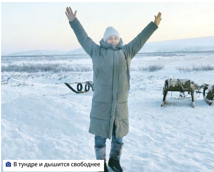
В тундре и дышится свободнее

7,8 млн тонн угля добыто на воркутинских шахтах за весь военный период. Именно за этот трудовой подвиг северных горняков Воркута и удостоилась высокого звания. За все годы существования шахт (когда-то их было 23, сейчас осталось всего четыре), с 1930-х по наше время, добыто 1 млрд 20 млн тонн угля!