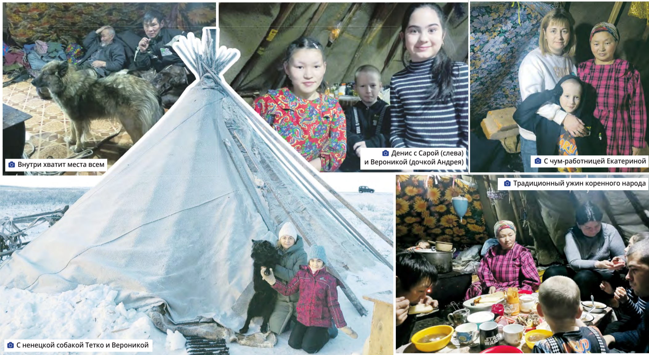
Внутри хватит места всем

Продолжение рассказа о поездке в Республику Коми