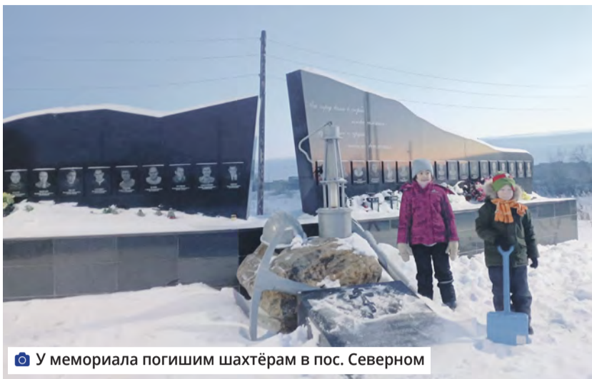
У мемориала погибшим шахтёрам в пос. Северном

В этот день в 1991 г. упразднён СССР и создано Содружество Независимых Государств (СНГ)