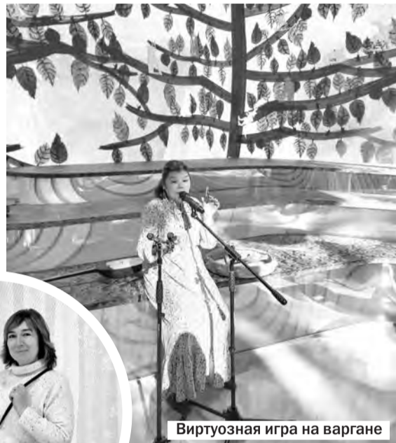
Виртуозная игра на варгане

Знакомство с Югрой начинается со встречи с мамонтёнком, который был найден во льдах Ханты-Мансийского округа. Мамонтёнок в натуральную величину, вмёрзший в лёд, при наведении на него камеры «оживает» и, покачивая хоботом, рассказывает историю своего края. А круговая видеопанорама переносит посетителей в интересные и значимые места Ханты-Мансийского округа.