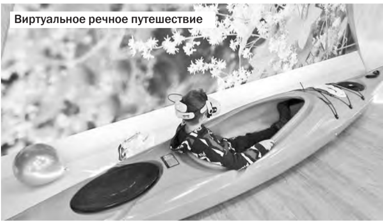
Виртуальное речное путешествие

Здесь всегда очередь от желающих сфотографироваться на память – от малышей в колясках до бабушек и дедушек! А ещё здесь можно найти подарки под ёлкой и даже написать письмо зимнему дедушке!