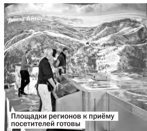
Площадки регионов к приёму посетителей готовы

фотографирования Арди пытается сделать красивое лицо для фото (прямо как мы, люди!). Кстати, у этого чуда техники — широкий спектр мимики, он способен выражать различные эмоции, взаимодействовать с людьми. А ещё у него эластичная силиконовая кожа. Ощущение, что общаешься с человеком! Над этим достижением искусственного интеллекта постарались пермские создатели — организация «Дабл Ю Экспо».