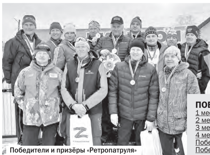
Победители и призёры «Ретропатруля»