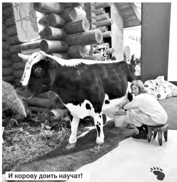
И корову доить научат!

Мне посчастливилось за несколько дней совершить путешествие по всей стране, заглянув в её различные уголки, и удивляться, любоваться и гордиться тем, что я живу в России.