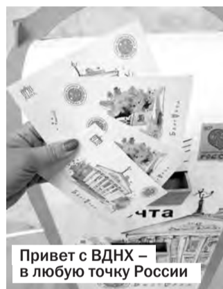
Привет с ВДНХ — в любую точку России

Он рассказал о ключевых достижениях края за последние шесть лет и о проектах, которые предстоит реализовать в ближайшие годы. Кроме того, отметил, что для прикамцев многое значит реализация национальных проектов, которые мы делаем по поручению президента Владимира Путина. Это строительство школ, медицинских объектов, благоустройство общественных пространств, поддержка института семьи, молодёжи и многое другое.