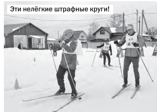
Эти нелёгкие штрафные круги!