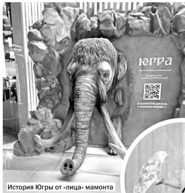
История Югры от «лица» мамонта

Международная выставка-форум «Россия» на ВДНХ – это возможность побывать во всех 89 регионах нашего Отечества