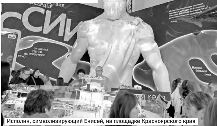
Исполин, символизирующий Енисей, на площадке Красноярского края