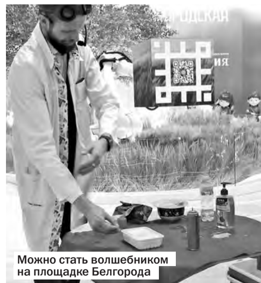
Можно стать волшебником на площадке Белгорода