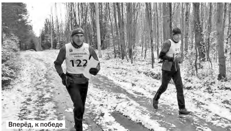
Вперёд, к победе