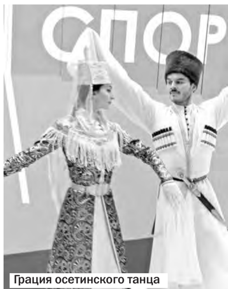
Грация осетинского танца

Добралась я и до резиденции Деда Мороза — в Великом Устюге Вологодской области. На выставке работает точная копия дома главного волшебника. Огромный белоснежный трон с оленями по бокам у великолепной новогодней ёлки никогда не пустует.