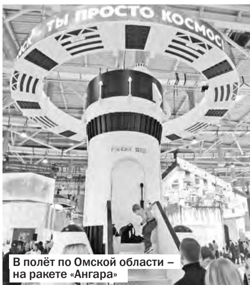
В полёт по Омской области — на ракете «Ангара»