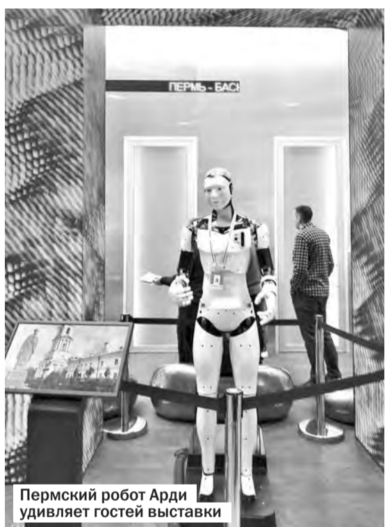
Пермский робот Арди удивляет гостей выставки