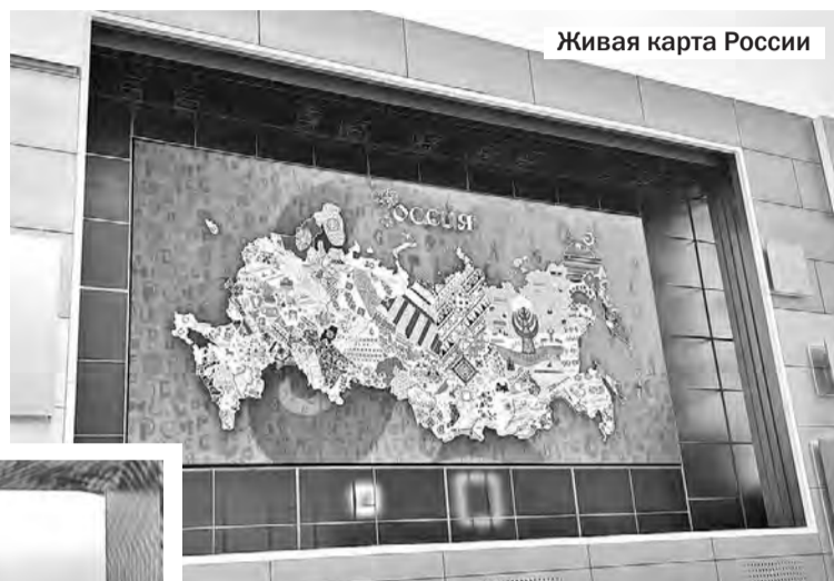
Живая карта России

Как известно, с 4 ноября 2023 года по 12 апреля 2024 года в Москве на ВДНХ проходит грандиозное по масштабам и воображению событие — выставка регионов России, посвящённая достижениям каждой области в науке, технике, культуре, промышленности, энергетике, строительстве, транспорте.