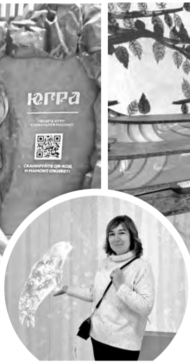
«Знакомство» с нерпой в Магаданском крае

...А вы знали, что у коренных народов Севера есть десятки слов для обозначения снега?! К примеру, снег, состоящий из крупных снежинок, обозначается одним словом, а плотный, которым ме-