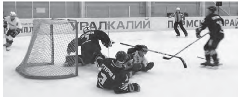
Хоккейные баталии в разгаре