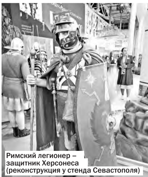
Римский легионер — защитник Херсонеса (реконструкция у стенда Севастополя)