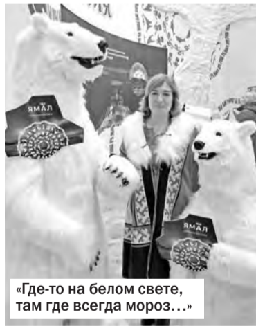
«Где-то на белом свете, там где всегда мороз...»

Делаю для себя пометку на будущее: надо обязательно побывать на Камчатке!