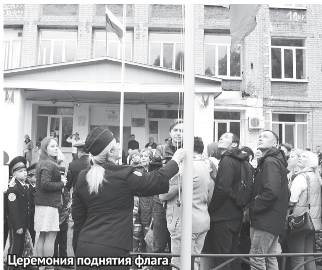
Церемония поднятия флага