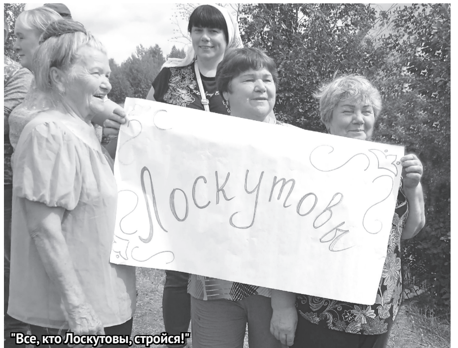
"Все, кто Лоскутовы, стройся!"