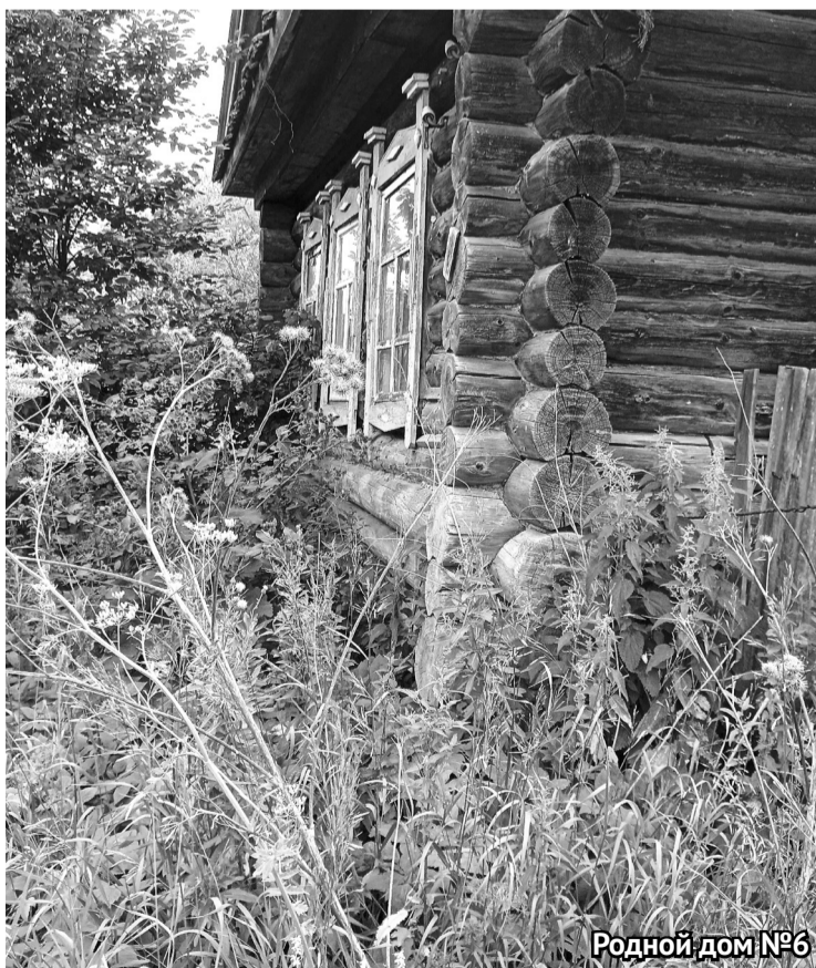
Родной дом №6