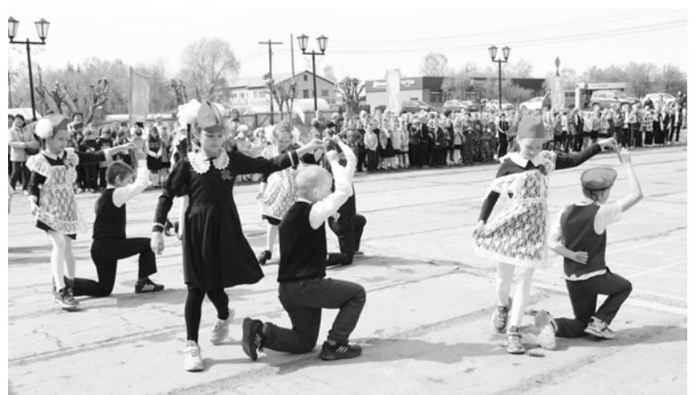
Пока подводятся итоги смотра танцуем «Вальс Победы».