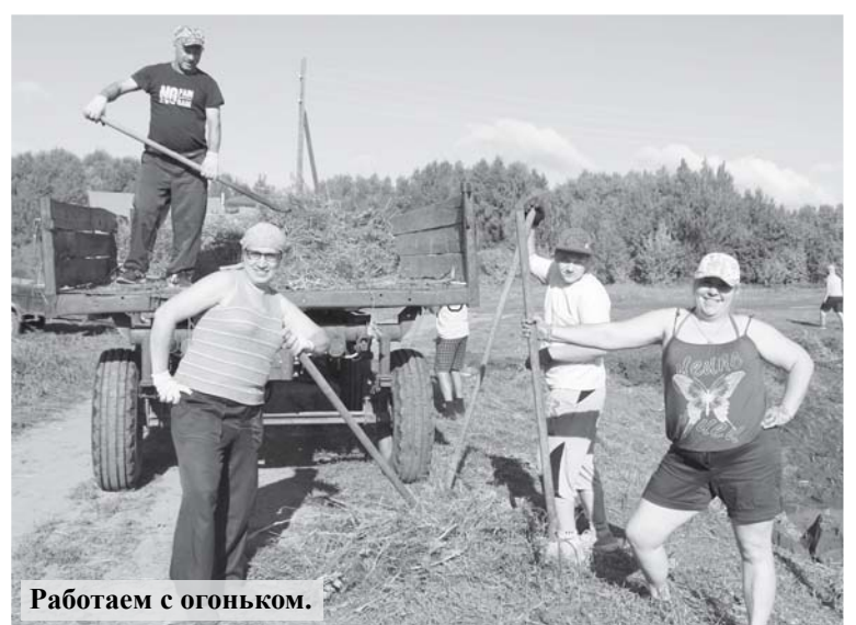
Работаем с огоньком.