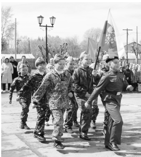
Держим крепко России знамя. 3 Б класс.