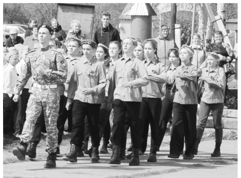
За нами Россия, за нами народ! 10 класс.