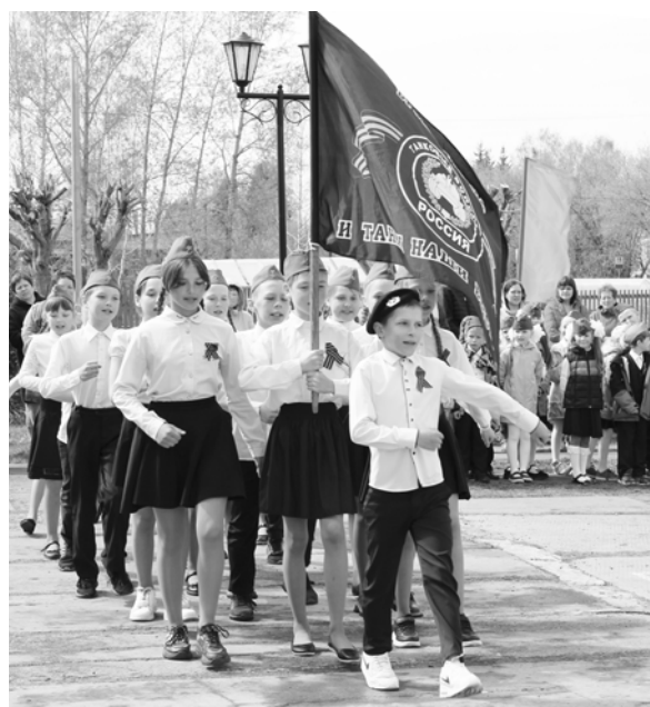
Если опасность державе грозит, станем едины, как монолит. 4 А класс.