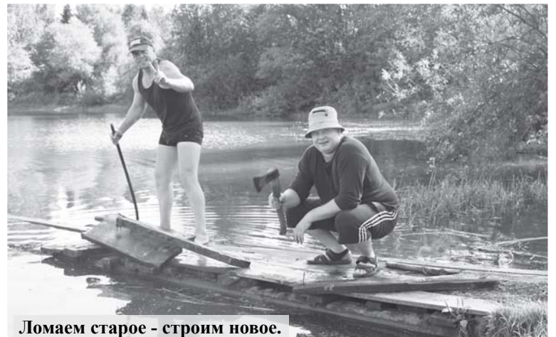
Ломаем старое - строим новое.