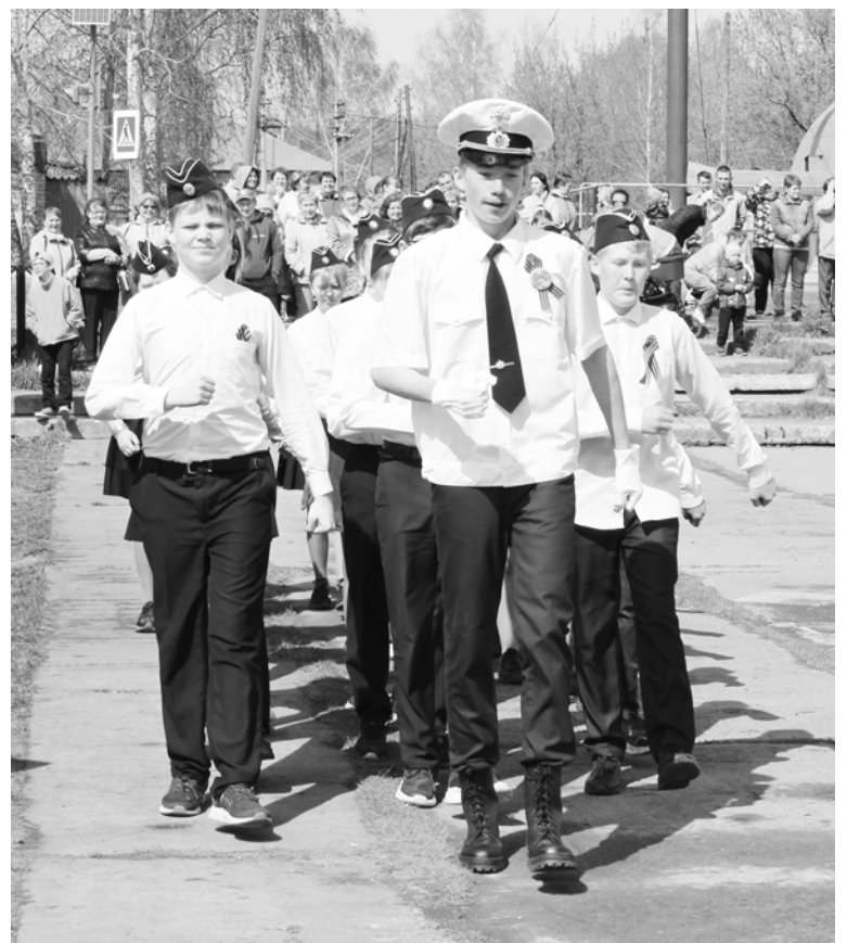
В каждом шаге огонь и сила. 7 класс.