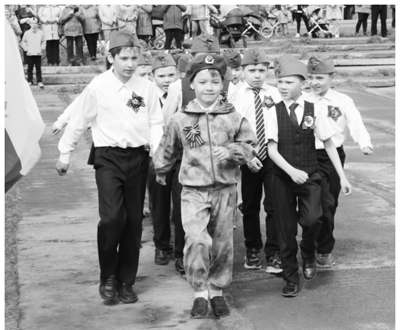
Так закаляется Родины сталь. На марше первоклассники.