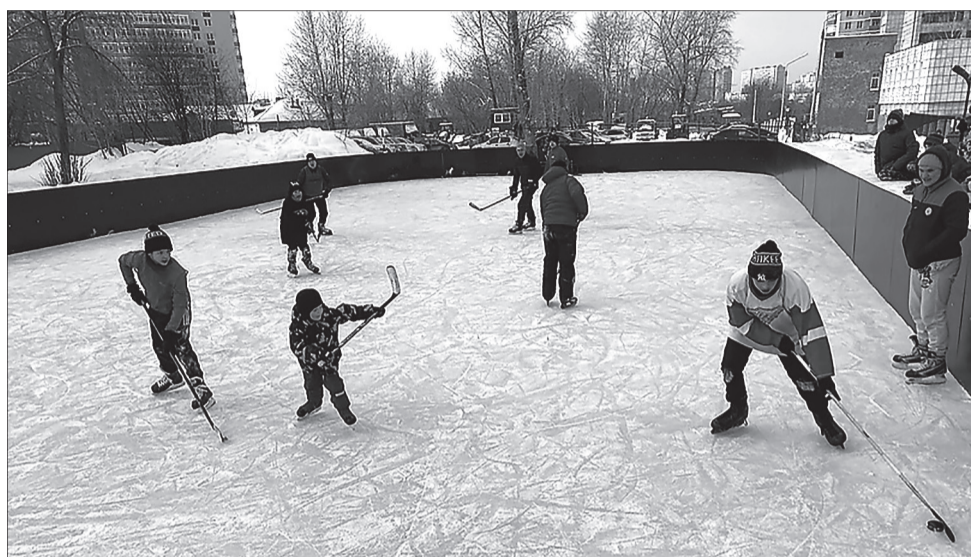
Хоккейная площадка, созданная по инициативе некоммерческой организации, не пустует ни зимой, ни летом

– Антон Константинович, расскажите как жители микрорайона пришли к необходимости создания ТОСа. Что удалось сделать благодаря его созданию?