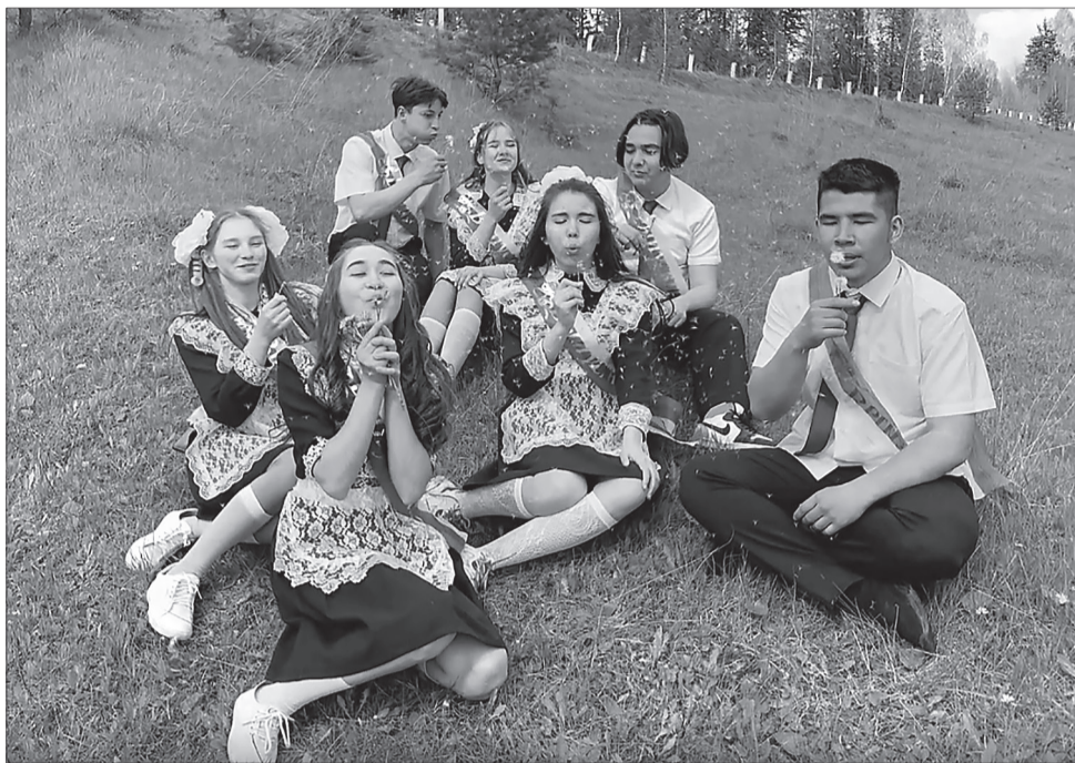
Выпускники 2022 года выпуска