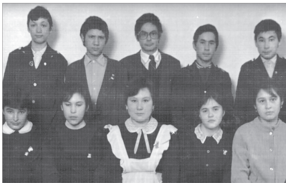
Первый выпуск Верхнесыровской общеобразовательной школы, 1989 год