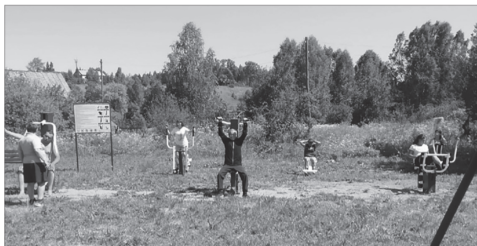
6 уличных тренажеров установлено в селе Завод Михайловский благодаря поддержке фонда грантов губернатора Пермского края. Активисты ТОС вынашивают идею о расширении спортивной площадки

Поддержка ТОС в Пермском крае не ограничивается только финансированием реализации проектов.