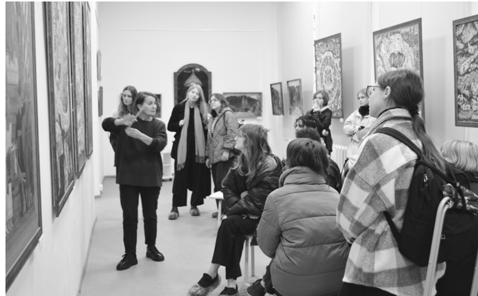
Студенты Пермского училища в одном из залов картинной галереи.

Около полутора тысяч гостей посетили Оханский краеведческий музей и художественную галерею с начала года. Поток желающих побывать в нашем городе растет. И это в первую очередь – заслуга сотрудников музея.