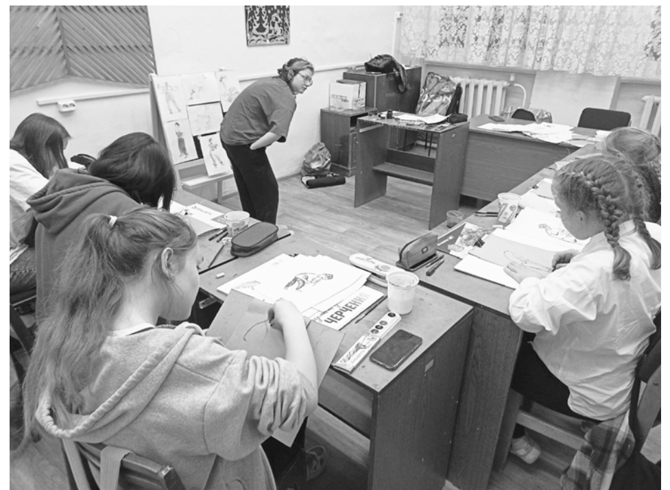
Студенты провели мастер-классы в студии ИЗО ДШИ и студии «Акварин».