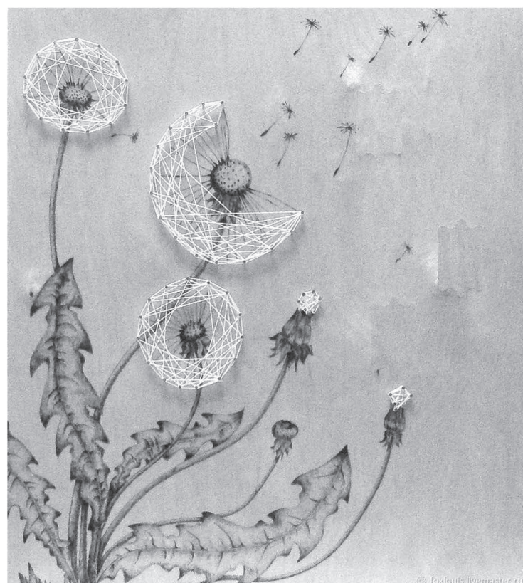
А это панно сочетание уже двух техник в рукоделии – это пирография и стринг-арт, вид графики, суть которого в том, что рисунок создается путем особого переплетения нитей.