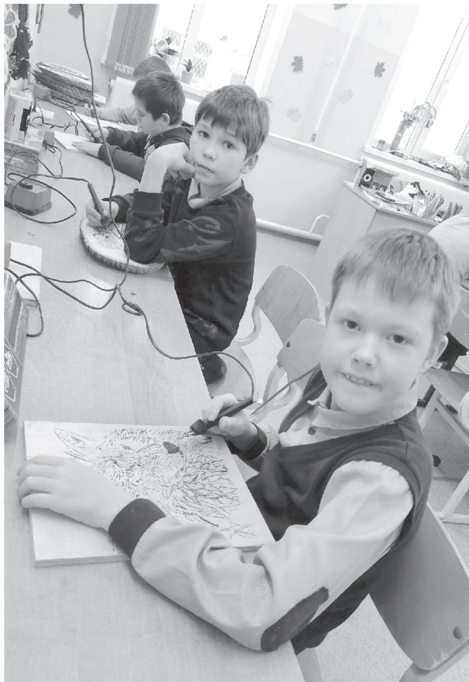
Дети с удовольствием учатся древнегреческому ремеслу – пирографии.