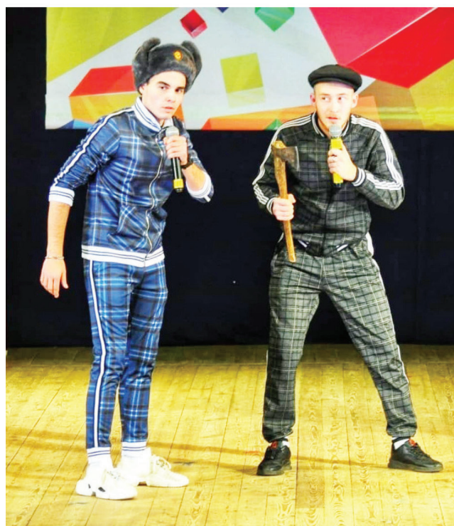
На сцене. Момент игры.