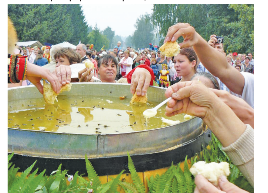
«Медовый спас» в с.Уинское - один из самых любимых фестивалей в Пермском крае