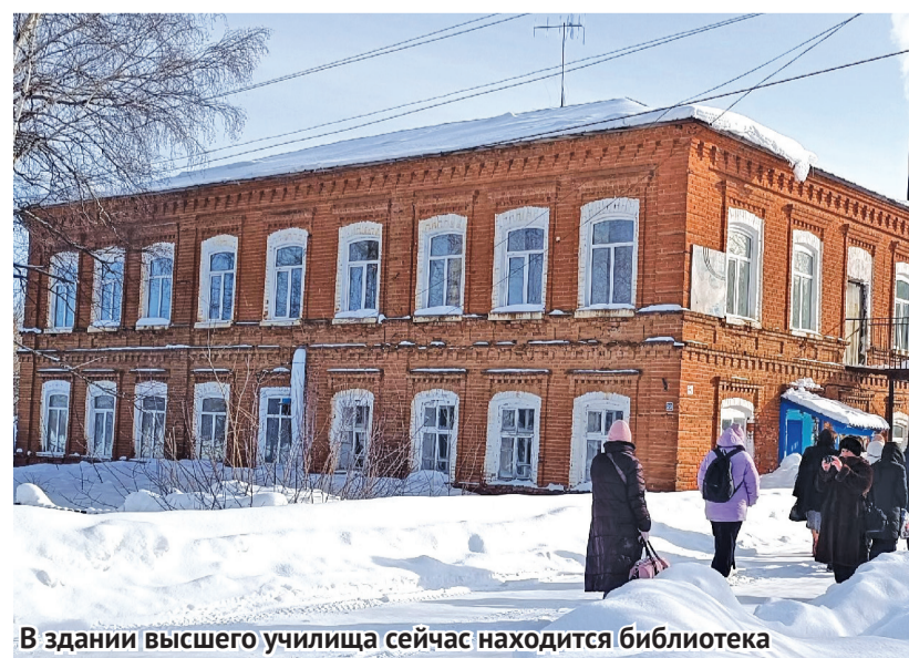
В здании высшего училища сейчас находится библиотека