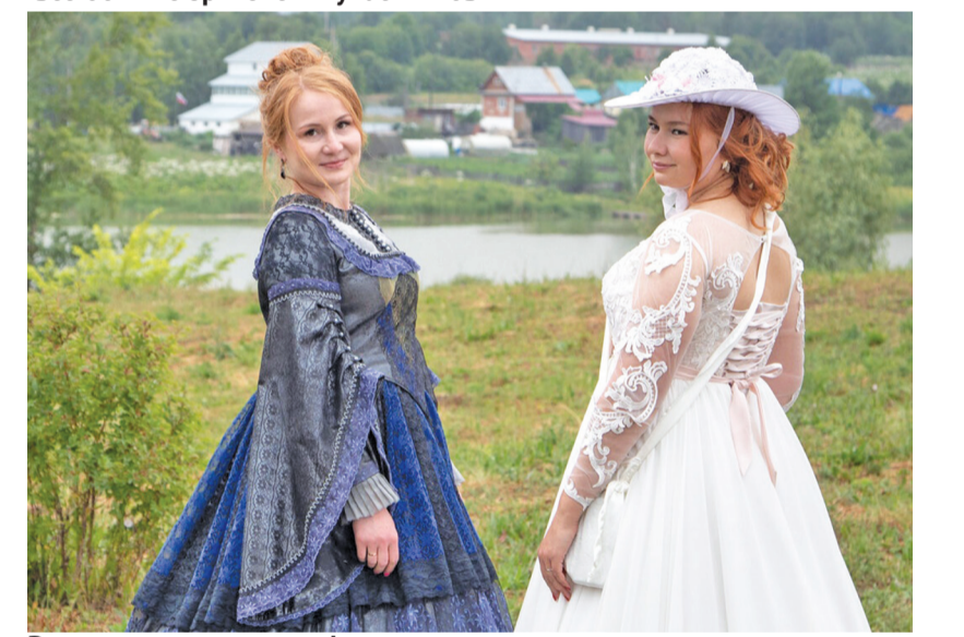
Роскошные наряды на фоне природы от известного фотографа Алексея Гречищева