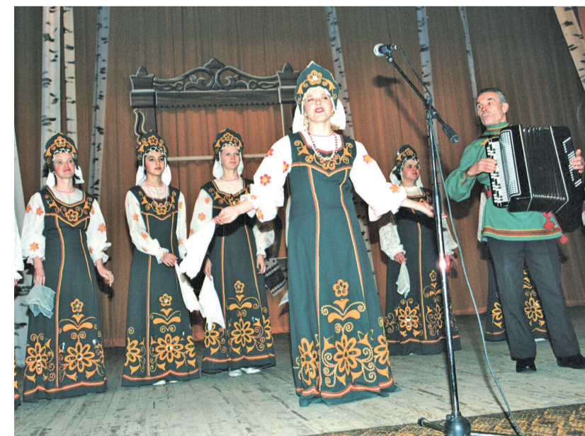
В 1989 г. Рябковскому хору присвоено звание «Народный»