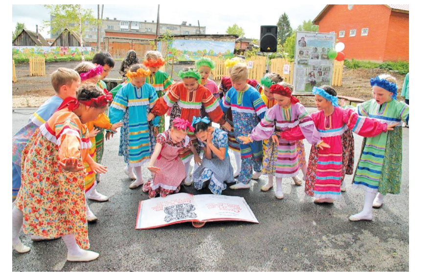
Фестиваль сказок «Ореховая веточка» - визитная карточка п.Октябрьский