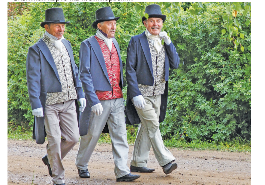
Фестиваль «Несравненная Бикбарда» с каждым годом собирает всё больше зрителей и участников