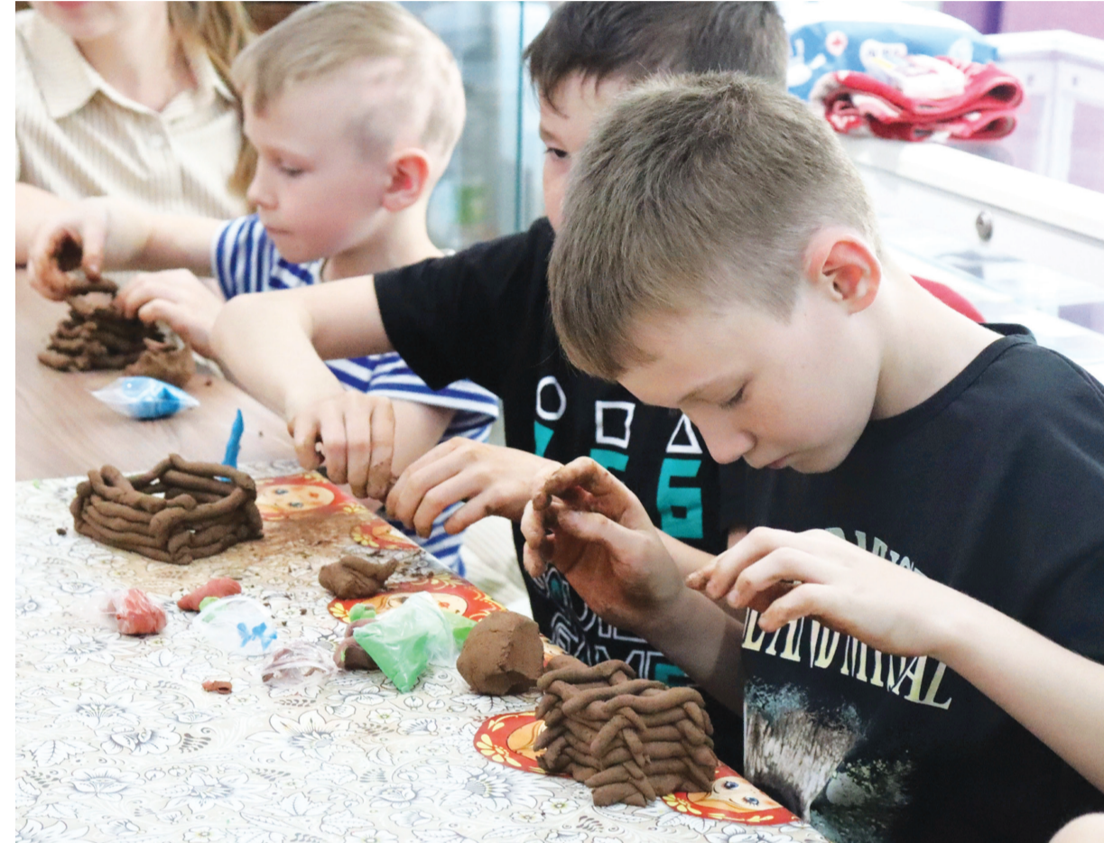
Чернушка из глины. Мастер-класс для детей

«Восстановление памятника в первозданном виде – это выражение нашего признания заслуг реформатора Александра II и одновременно извинение за совершенный акт вандализма, ведь это памятник не только Царю, но и нашим предкам – крестьянам, которые здесь жили», – говорит краевед.