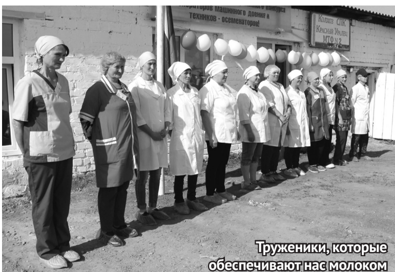
Труженики, которые обеспечивают нас молоком