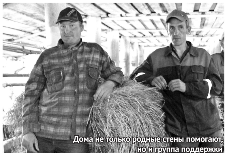
Дома не только родные стены помогают, но и группа поддержки