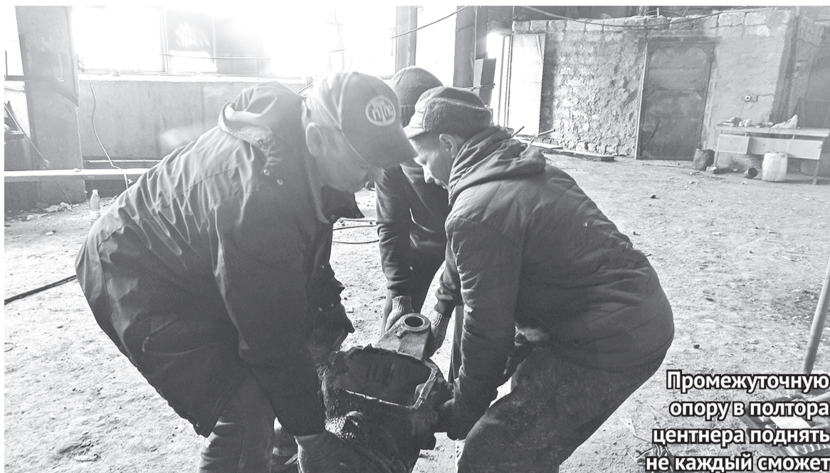
Промежуточную опору в полтора центра поднять не каждый сможет