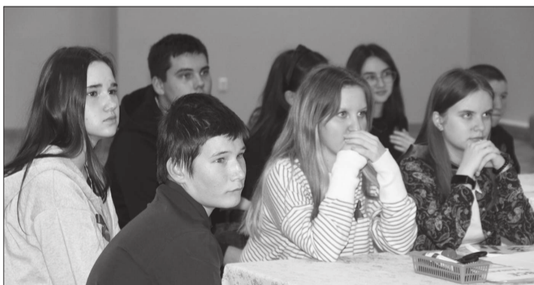
📷 На киноуроке «Всё возвращается» ребята внимательно смотрели фильм о землетрясении в Армении, которое шокировало мир в 1988 г.