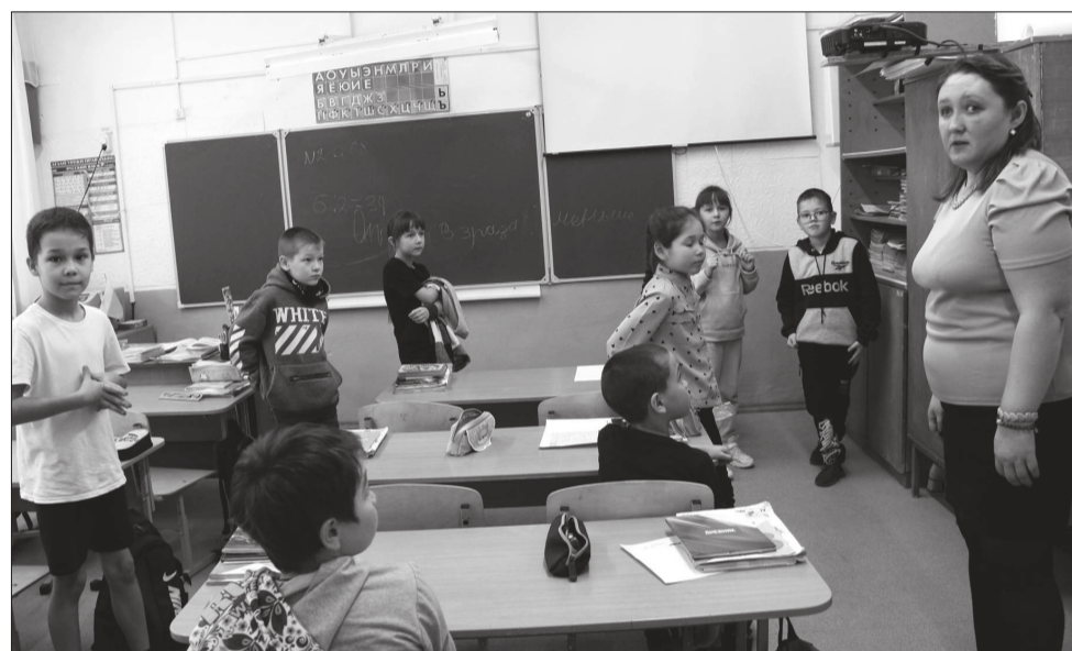
Ребятам на первом этаже даже жарко.

Что не так с отоплением в школе и почему одни дети мерзнут, а другие в это же время в этом же здании - изнывают от жары? Мы решили побывать в школе и пройтись по классам. Сразу оговорюсь, что в день нашей командировки на дворе