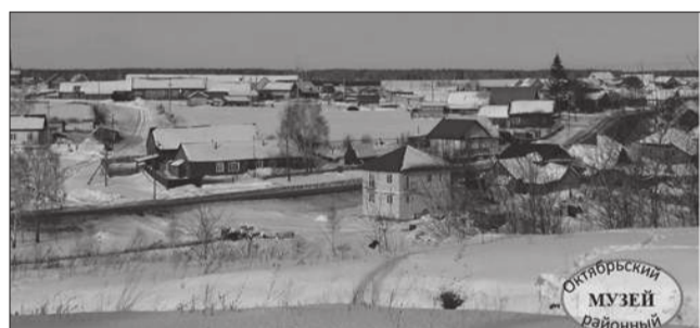
Село Богородск - центр одноименного района в 1923-1931 годах. 2013 г.