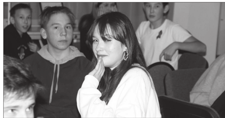
📷 На исторической игре «Знатоки своего района» вопросы были сложные даже для взрослых. Вы знаете, в каком году образовалось ЛПУ «Алмазное» или какие церкви считаются объектами культурного наследия?