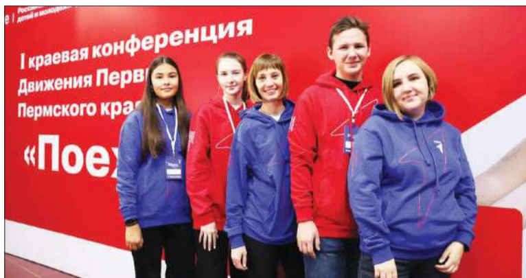
Делегация Октябрьского округа на форуме.

Итоги года подвел председатель Совета регионального