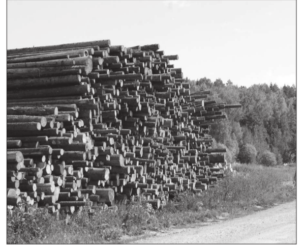
Штабеля день ото дня растут.

В очередной командировке по приреченской зоне мы увидели большое количество бревен, что лежат справа от дороги на въезде в деревню.