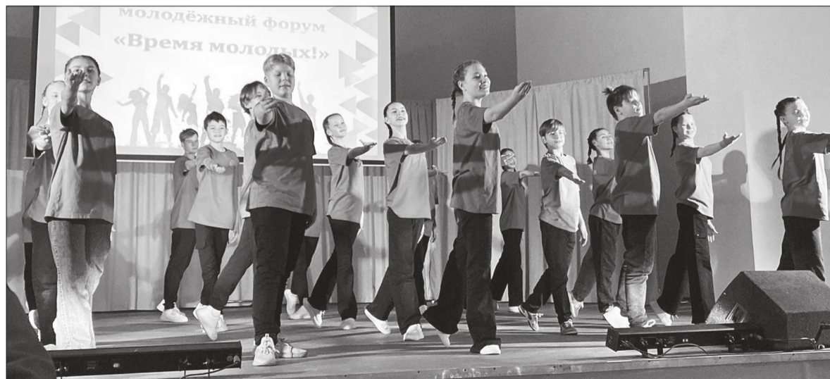
📷 Открывал и закрывал торжественную часть мероприятия танцевальный номер образцового хореографического ансамбля «Апельсин» от Детской школы искусств.