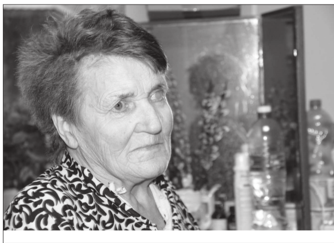
Н.В. Райкина считает себя человеком верующим.