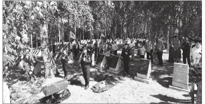
📍 Торжественная церемония захоронения И.М.Лихачева.