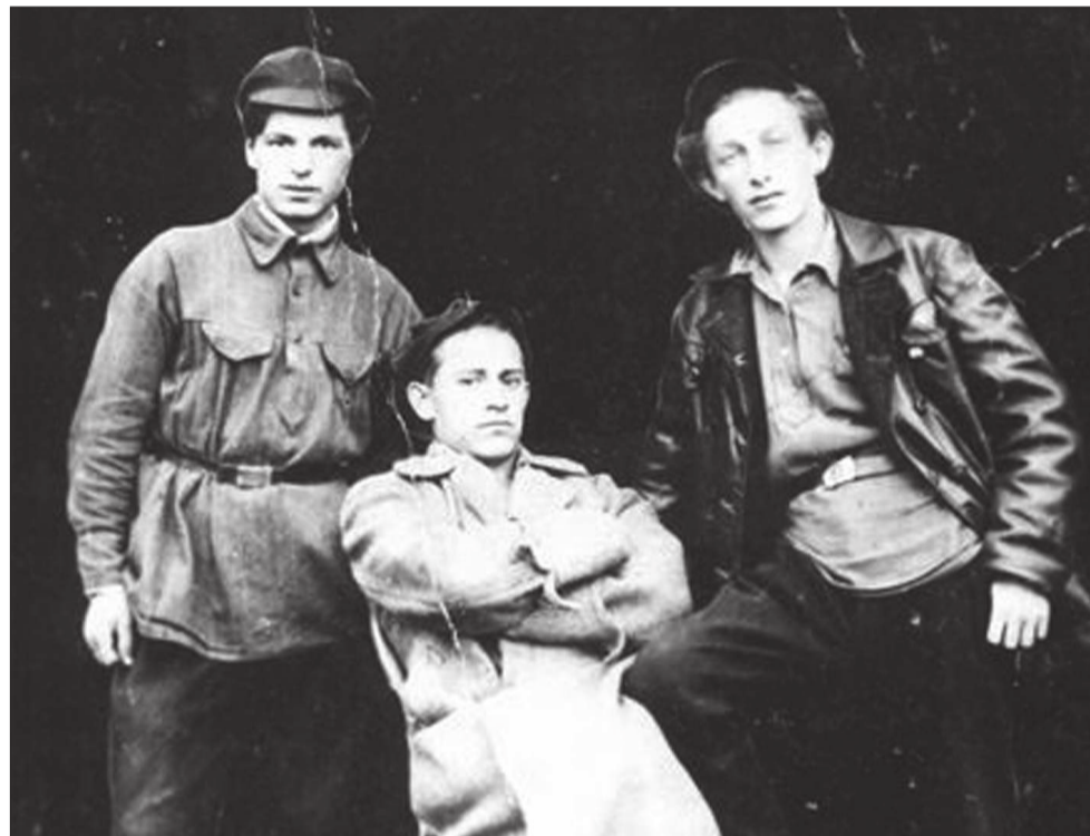
В.М. Шаров (в центре) с товарищами. 1920-е гг.