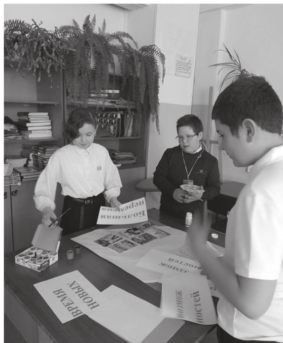
Ребята делают афишу клуба.