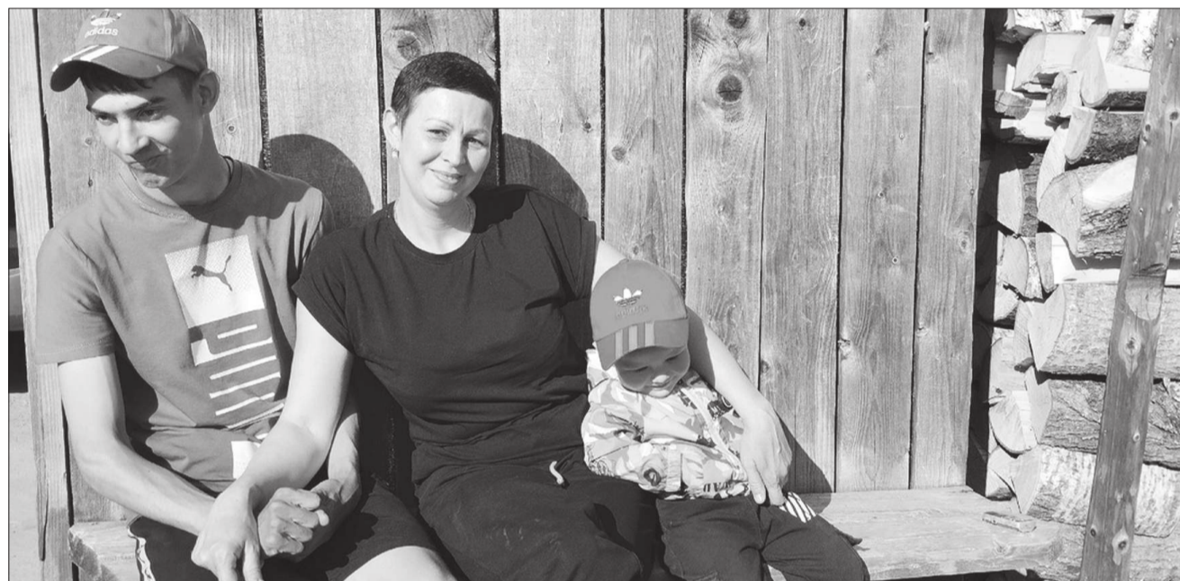
Сережа планирует подрасти и заниматься на турнике. А мама заранее понимает, что это будет сложно: руки плохо слушаются мальчишку.

Давай за жизнь. В многодетной семье Мизёвых из Щучьего-Озера любят каждого из детей