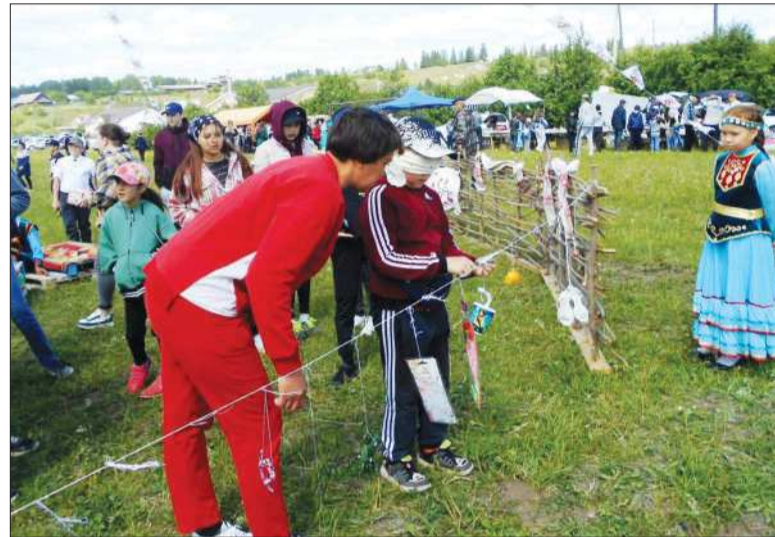
Праздник плуга - Сабан туй - прошел в минувшие выходные в селе Ишимово.

Окончание посевных работ уже отметили: 10 июня в деревнях Верх-Шуртан, Седяш и Верх-Ирень; 11 июня - в селах Ишимово и Енапаево.