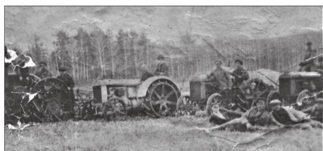
Тракторная бригада совхоза «Тюшевской». 1926 г.