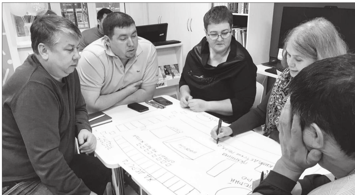
Идей на встрече было высказано очень много.

Самоуправление. На стратсессии шел разговор о будущем округа