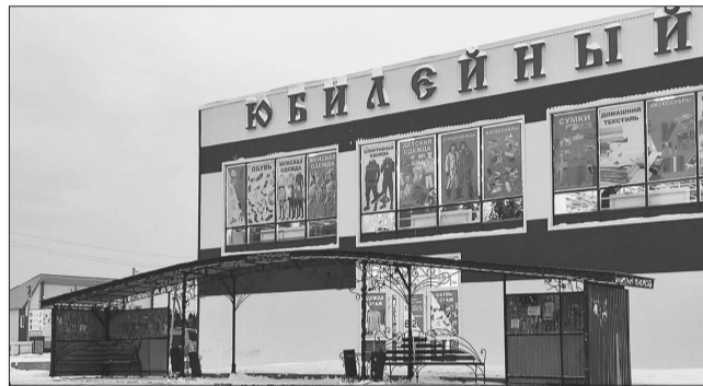
Так выглядит остановка сегодня.

«Хорошо в округе нашей: Песни пляшем, музыку поём. Только на центральной остановке Зимой и летом дубаря даем».