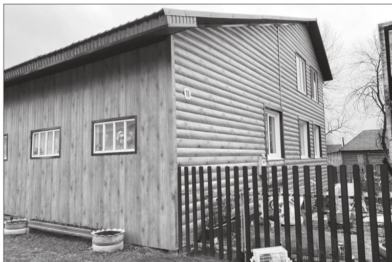
В новый дом Авлияровы заехали еще до того, как дети ушли служить по контракту.

А когда у меня сын первые полгода или год отслужил, то взял кредит на пять лет на миллион, приехал домой и все до копейки нам отдал. Я вот тогда все деньги на пол разложила, никогда столько наличных не видела, легла в них и фоткалась", - задорно смеется татарочка.