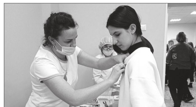
Каждый участник молодежного форума получил красную ленточку в рамках акции борьбы со СПИДом.

В 2023 году Всемирный день борьбы со СПИДом проводится под