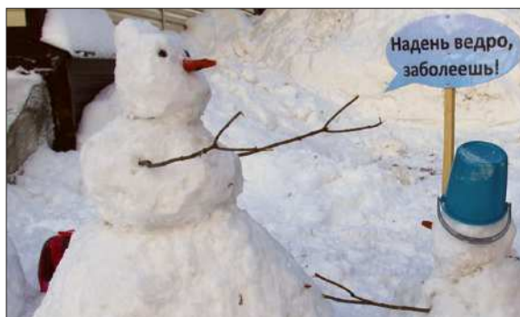
Даже снеговики боятся замерзнуть.

Телефон вызова служб экстренного реагирования: «01» - со стационарного телефона, «101», «112» - с мобильного телефона, вызов бесплатный. «Телефон доверия» Главного управления МЧС России по Пермскому краю: 8(342) 258-40-02.