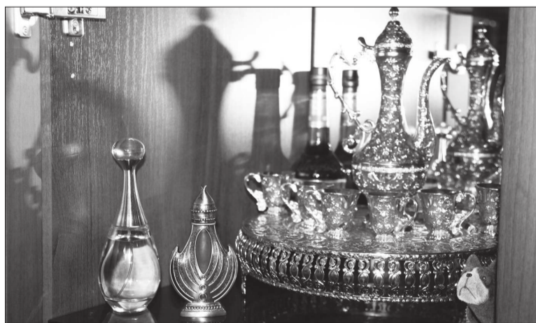
Сирийские сервизы - подарок старшего, который трижды был в Сирии.