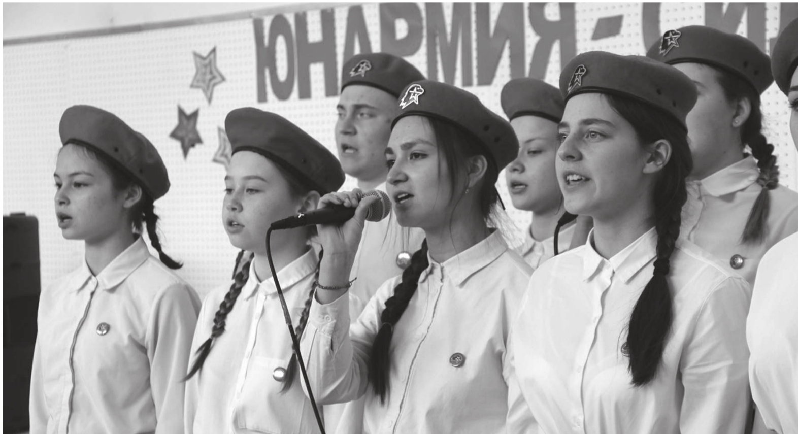
На выделенные средства на проект «Юнармия, вперед!» будет закуплено обмундирование для поста №1 из школьного клуба «Патриот», чтобы ребята могли участвовать в «Вахте памяти» и других торжественных мероприятиях.

Подробности. 8 проектов округа победили в XXII Конкурсе социальных и культурных проектов Компании "ЛУКОЙЛ"