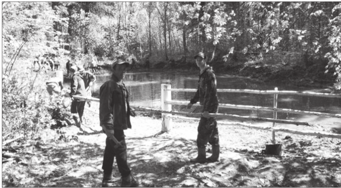
Жители деревни Бикбай чистят любимое озеро сообща

Изначально деревня называлась Крымсараево, а основателем ее значился Бикбай Крымсараев. Местные историки считают, что все населенные пункты по реке Ирени пошли именно от них.