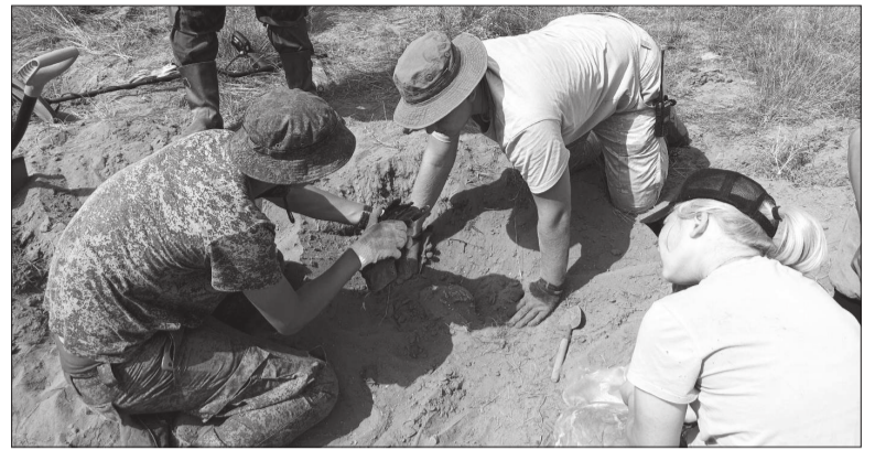
📍 Поисковые работы в Волгоградской области. / ФОТО: В. ПЯНКОВОЙ