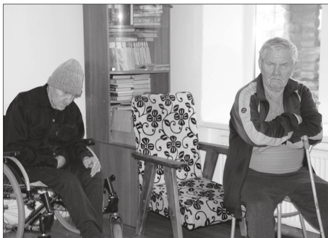
В приюте есть небольшая библиотека.

– Вы бы написали про Борисовну чего хорошее, а то приходят разные коммисии, ищут недостатки, а она потом ревет, - обращается с доброй просьбой мужчина в конце разговора. – И муж её Володя всё делает, старается. И повара стараются.