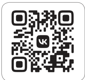
📍 Группа в ВК «Поисковое движение России».