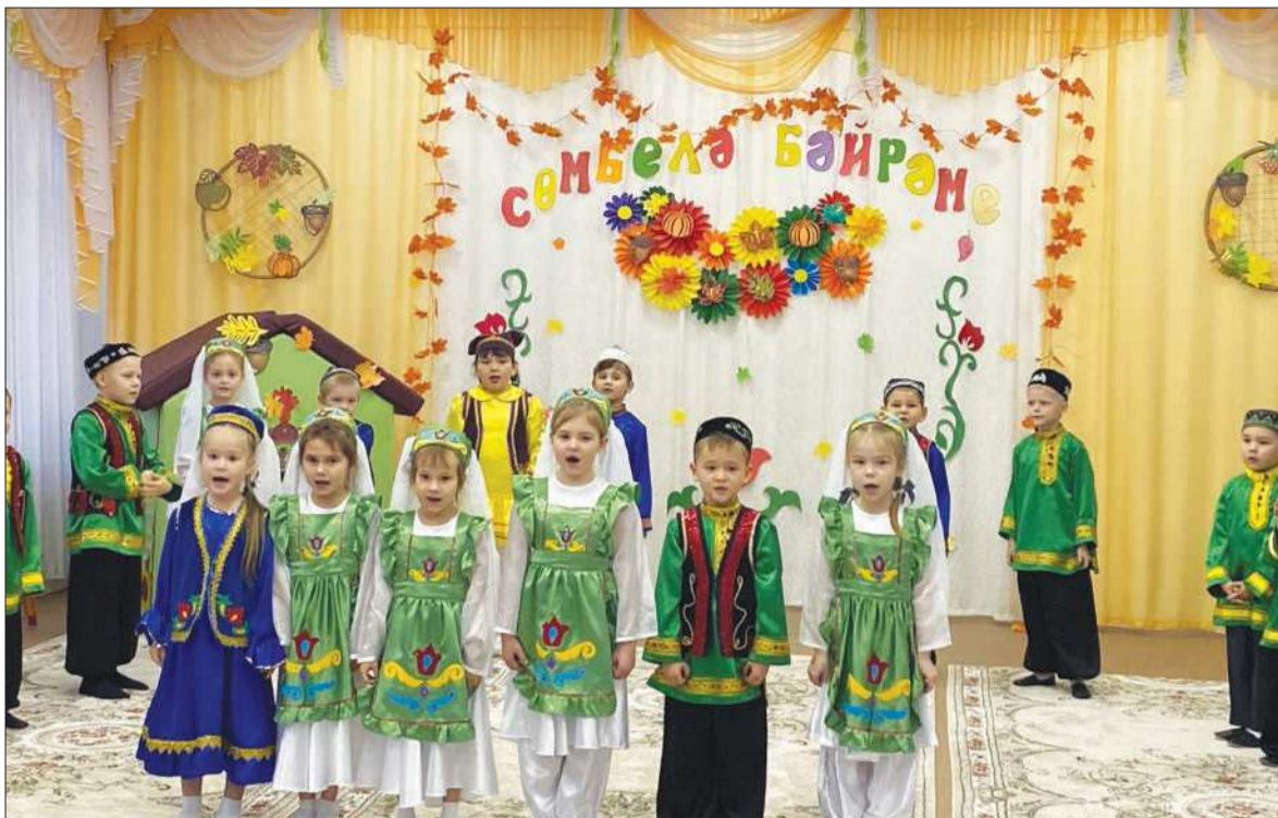
Слаженный профессиональный коллектив знакомит малышей с традициями семьи, культурой русского и татарского народов.