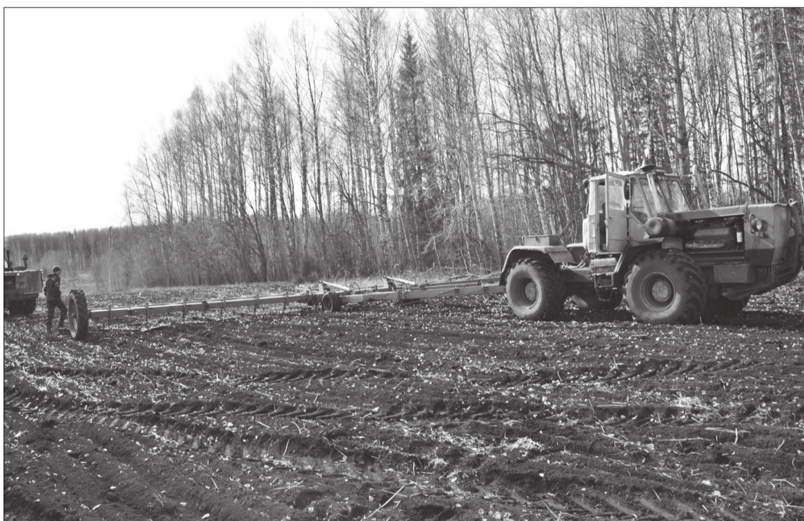
Самые большие посевные площади в округе - в СПК «Богородский».

«На 1 мая из краевого бюджета уже доведено до сельхозпроизводителей 1,2 млрд руб., что составляет порядка 40% предусмотренных на господдержку сектора АПК в целом. Это почти в семь раз больше