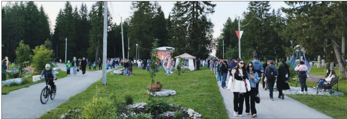
Точка притяжения жителей округа - парк культуры и отдыха в рп. Октябрьский.