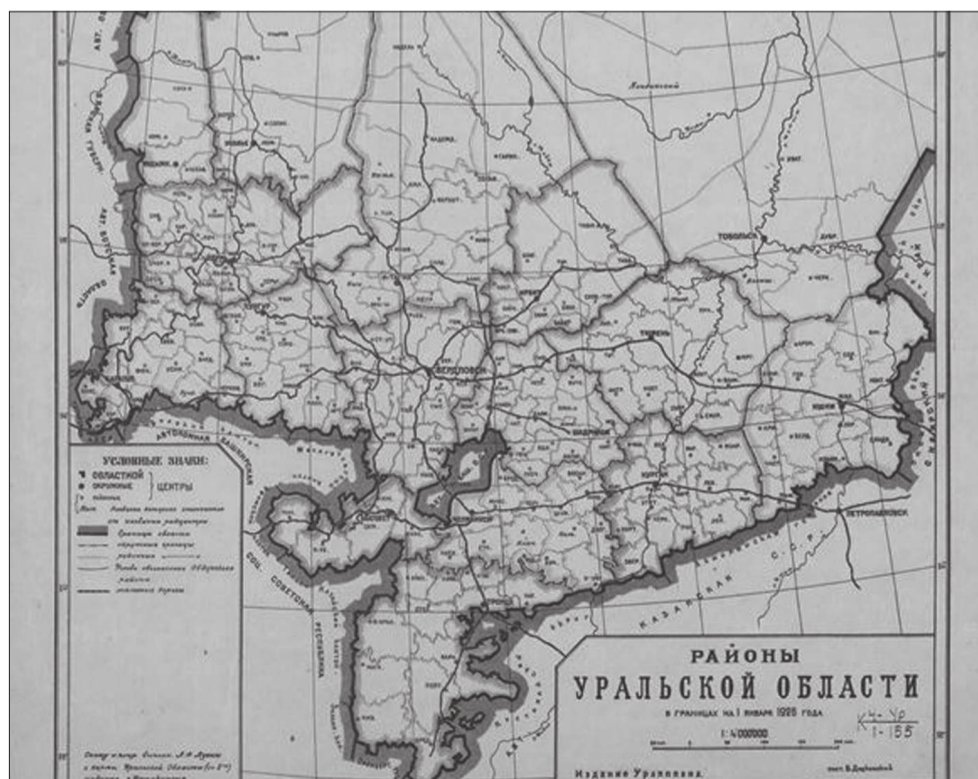
Карта районов Уральской области в границах на 1 января 1926 г.