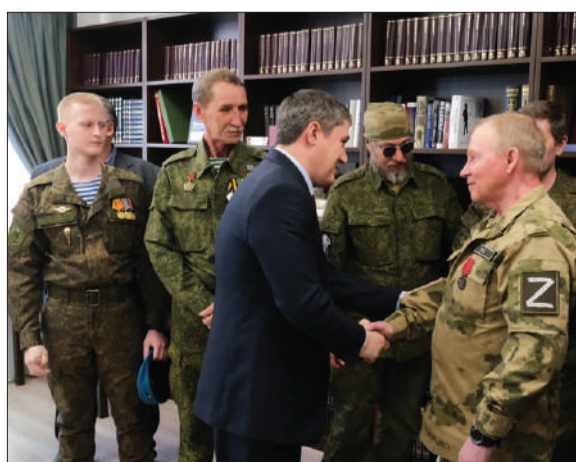
Губернатор Пермского края Д.Н. Махонин приветствует участников СВО. / ФОТО ПРЕСС-СЛУЖБЫ ГУБЕРНАТОРА

Александр Давыдов. Источник: газета «Звезда» № 16 от 28 апреля 2023 года