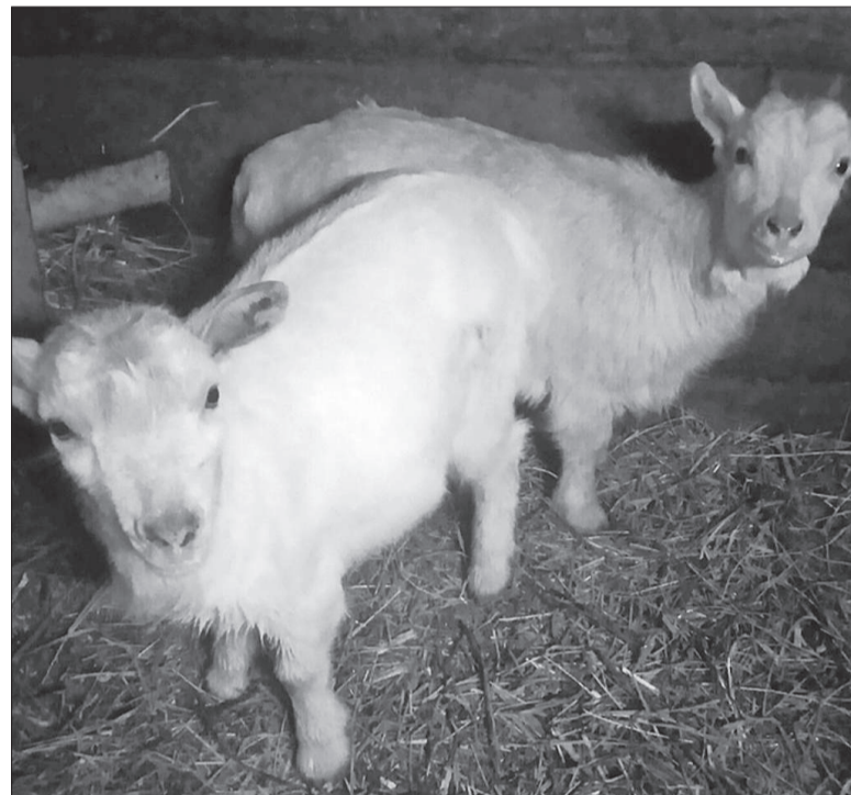
Лелик и Болик.

- Овец и коз зарегистрировано 2200 голов. Поголовье МРС растет, в основном, за счет коз. Люди переключаются с коров на мелкую живность, потому что уже и семей боль-