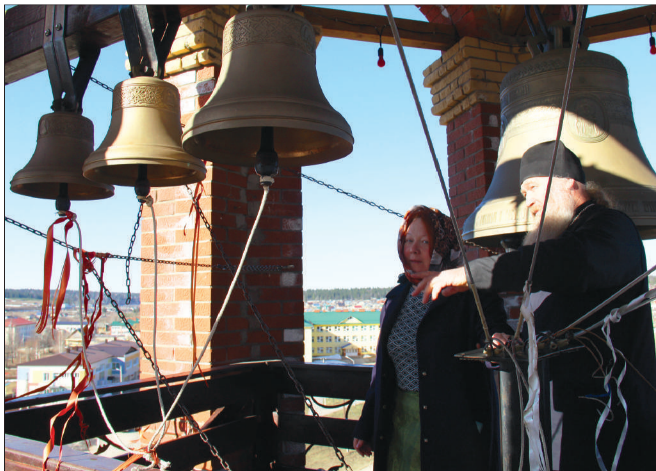
☞ Большой Благовест весит 970 кг, малый Благовест – 500 кг, рядом зазвонная тройка небольших колоколов, которые дают мелкий звон, за ними – малые подзвонные. Изготовлены они все по заказу в Воронеже.

Фотофакт. Настоятель храма преподобного Сергия Радонежского о смысле Пасхи