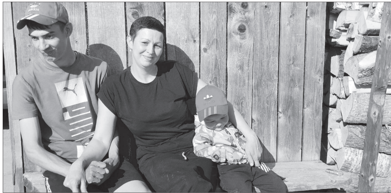
Сережа планирует подрасти и заниматься на турнике. А мама заранее понимает, что это будет сложно: руки плохо слушаются мальчишку.

Давай за жизнь. В многодетной семье Мизёвых из Щучьего-Озера любят каждого из детей