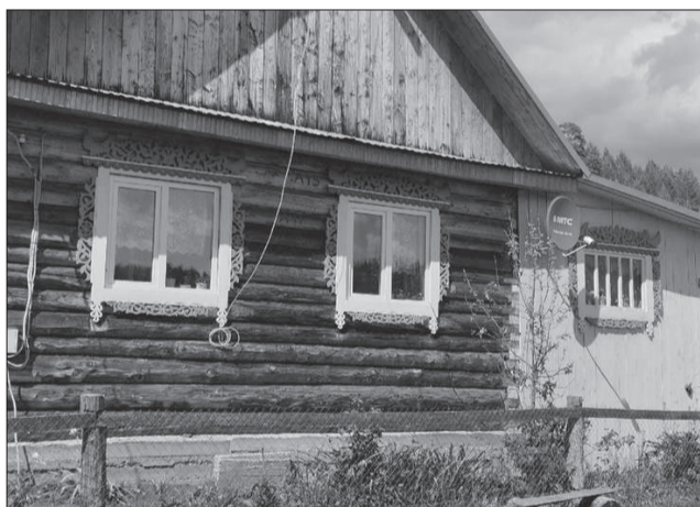
Все вместе под одной крышей.

- На кошку ругаться не дает, сразу застывает. Он с ней разговаривает, а она ему отвечает, мяукает. Если сигареты пачками у него лежать будут, он нервничать начинает, сразу ищет шабашку. Медом не