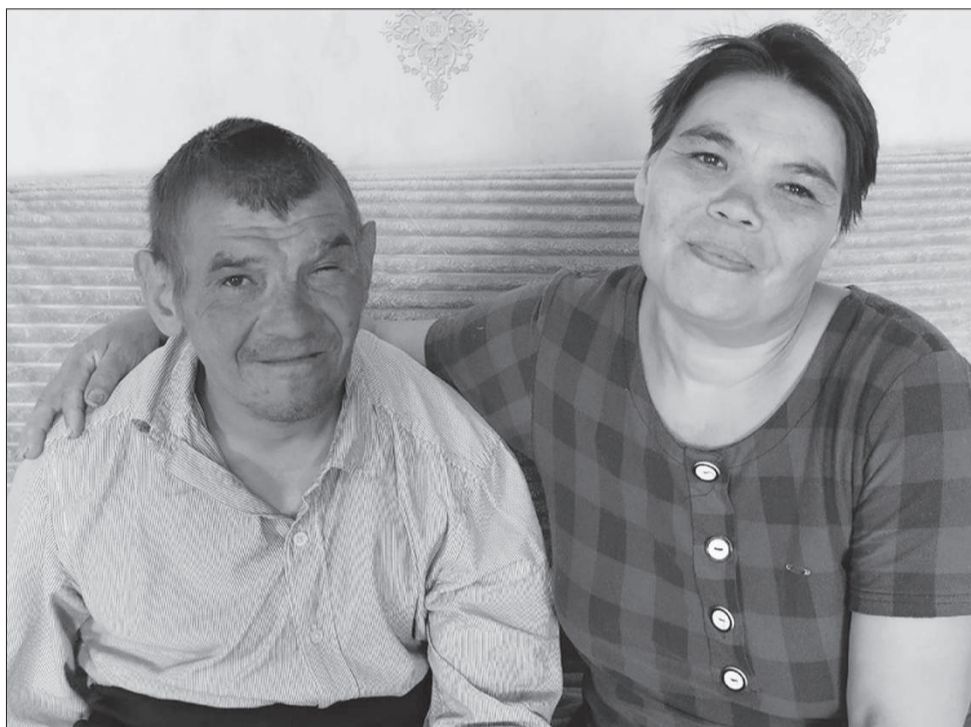
«Как бы ни было, а брата не оставим».

- А чего рассказывать-то? - не понимает причину внимания к её семье женщина. - Инвалид есть инвалид. Брат родной, хоть как будет: тяжело ли, легко ли, всё равно будет со мной. Он родился умственно отсталым. Государство платит ему пенсию - 19 тысяч в месяц. А мне по уходу за ним - 5 тысяч.