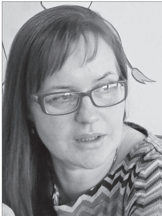
«Да никакой я не герой».