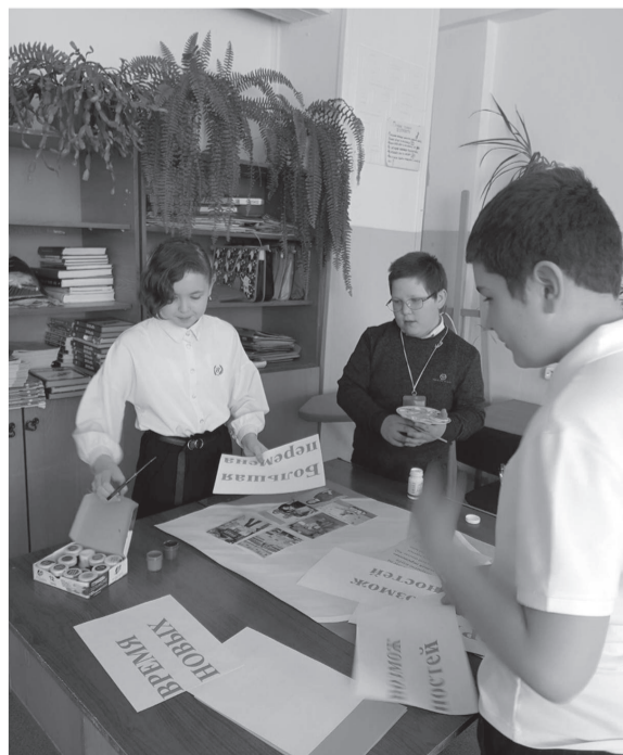
Ребята делают афишу клуба.

- Клуб начал свою работу: вступили в лигу Большой перемены Пермского края, создали свой сайт, на котором зарегистрировались уже 60 человек, провели голосование за название клуба, включились в различные мероприятия. Активно клуб начнет свою работу с сентября нового учебного года, - прокомментировала Т.В. Алексеева.