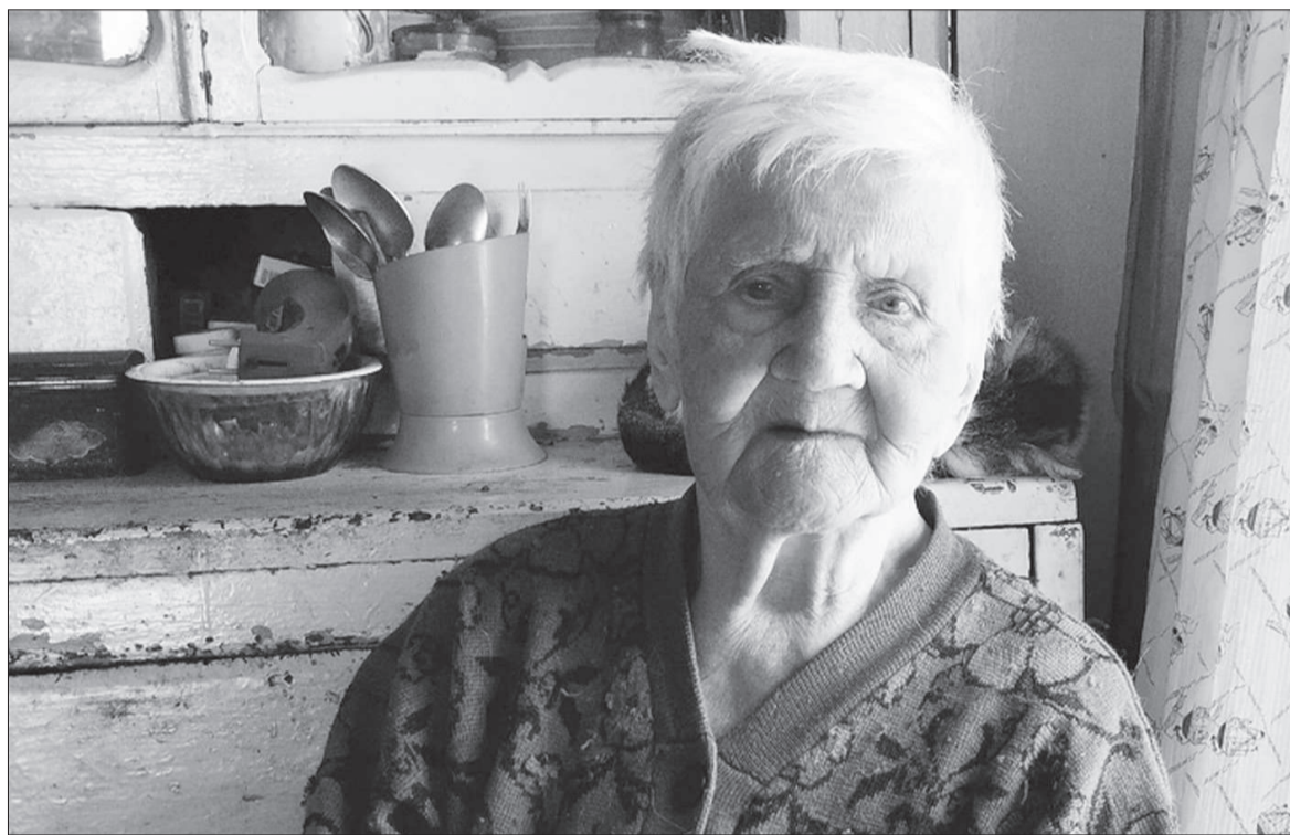
«Вот если бы умереть, год там полежать, а потом прийти обратно, посмотреть, как без меня тут жили», - смеется бабушка.