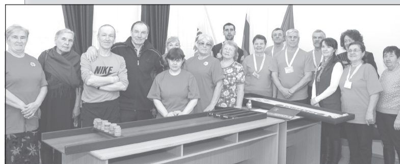
Верещагинская городская организация ВОИ, фото — Сергей ШИСТЕРОВ.