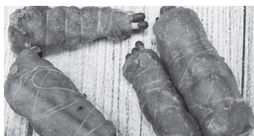
Розжиг от еловских умельцев будет пригодным, даже если побывает в воде