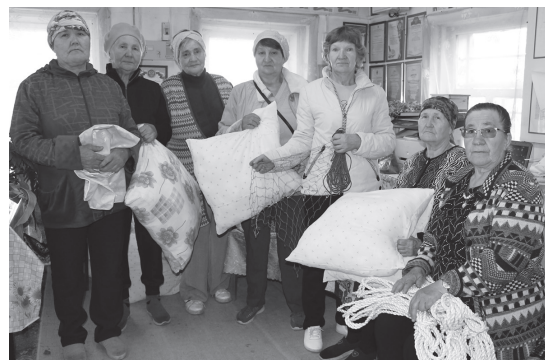
Ветераны из Куштомака и к благотворительности отнеслись с энтузиазмом

делать «сухой армейский душ», теребить синтепон, смастерила 2 костюма «леший».