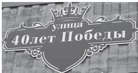
Название улицы 40 лет Победы воодушевляет жителей помогать