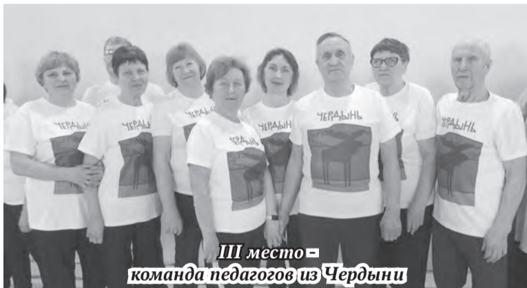
III место - команда педагогов из Чердыни

Спартакиада - мероприятие, завершающее проект «Чтобы тело и душа были молоды», реализуемого Чердынским советом ветеранов при поддержке Фонда президентских грантов. Участниками его стали пенсионеры города, занимающиеся в спортивных объединениях и прошедшие восстанавливающие процедуры в «Уголке здоровья», организованного на средства гранта, а также представители советов из территорий округа, также предпочитающие спортивное оздоровление.