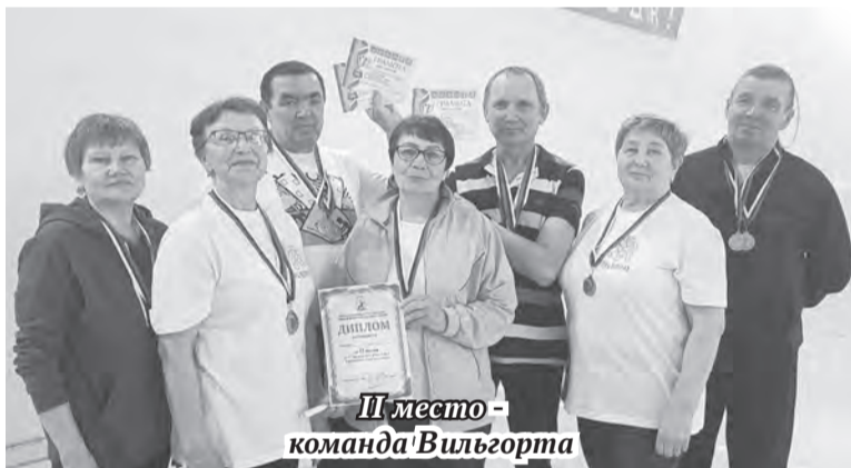
II место - команда Вильгорта