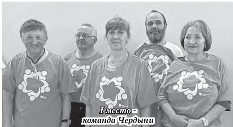
I место - команда Чердыни

П ожилый человек. Какие ассоциации вызывают обычно эти слова? Уютный плед, чашка чая перед телевизором, вязание, кроссворды и всё в таком стиле... А вот участники II Спартакиады среди пенсионеров Чердынского городского округа продемонстрировали совершенно другой образ своего бытия на заслуженном отдыхе - активную жизненную позицию, бодрость духа, спортивность и желание побеждать.