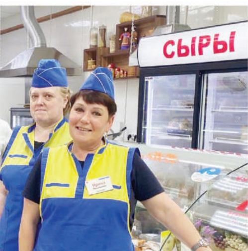
Коллектив магазина «Петровской»