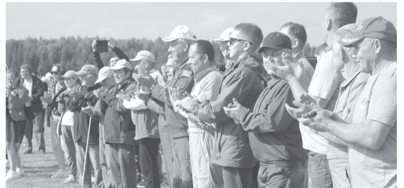
Участники соревнований – Кудымкар, Пермь, Набережные Челны