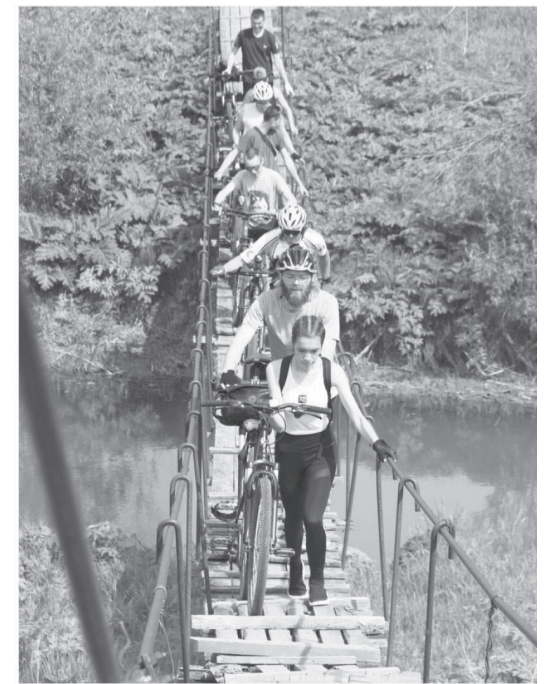
Маршрут открытия Велолета-2023 назвали «Три моста», ребятам предстояло еще и пройти пешком по трем висющим мостам через реку Велва