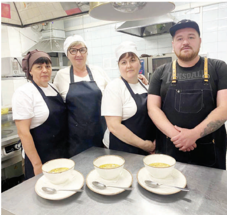
Конкретно настоящие повара