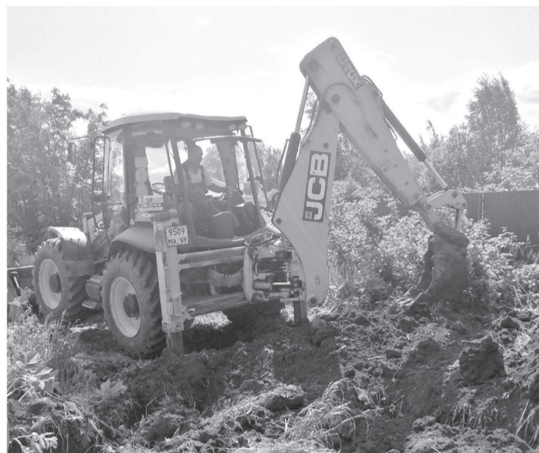
Земляные работы по подключению нового потребителя к водоснабжению

Ирина Радкевич