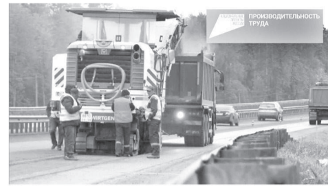
онального центра инжиниринга. На сегодняшний день 116 компаний Пермского края присоединились к нацпроекту.

Напомним, национальный проект «Производительность труда», инициированный президентом России Владимиром Путиным, призван создать условия для ежегодного прироста производительности труда не менее чем на 5% в целом по стране к 2024 году. Для реализации поставленных задач Правительством РФ разработан комплекс мер господдержки бизнеса, который включает финансовое стимулирование, поддержку занятости и экспертную помощь в оптимизации производственных процессов. На территории Пермского края оператором нацпроекта является Региональный центр компетенций, созданный на базе Реги-