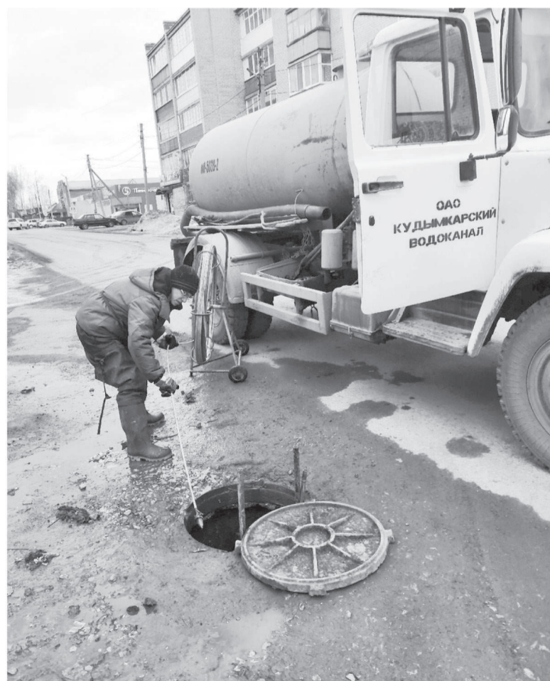
Устранение засора в системе водоотведения