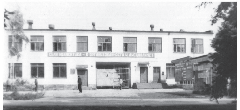
Общий вид здания Кудымкарского ремонтно-механического завода, проходная. (ул. М. Горького, 38), 03.07.1987