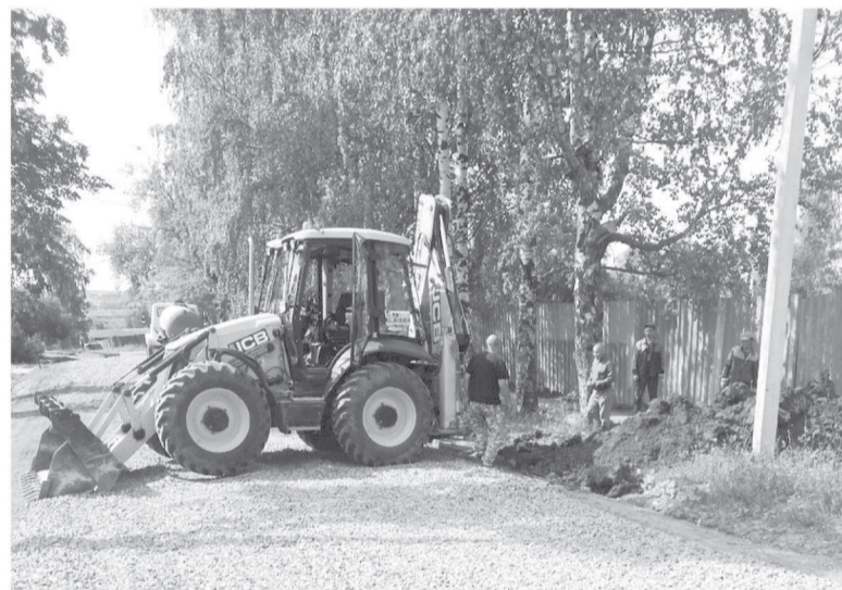
Как отмечают на предприятии: «Стараемся работать, не повреждая дороги общего пользования»