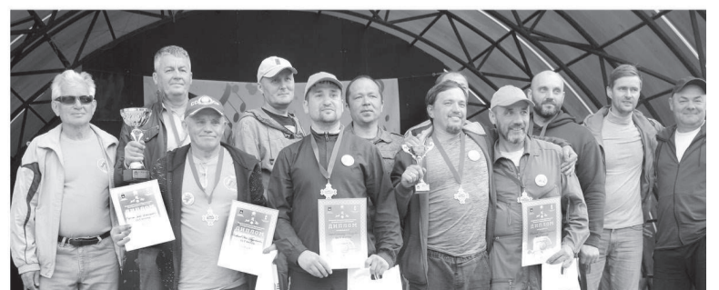
Победители и призеры открытого Чемпионата по сверхлегкой авиации, г. Кудымкар