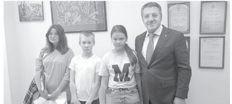
Юные волонтеры из школы № 2 рассказали о своих добрых делах, депутат пообещал поддерживать волонтерский отряд

В соответствии с проектом здание будет одноэтажным, его площадь составит 1287,7 квадратных метров. Финансирование строительства ведется