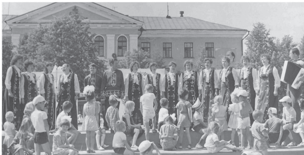
Хор Ремонтно-механического завода на городской площади в день молодежи, июнь 1986 г.