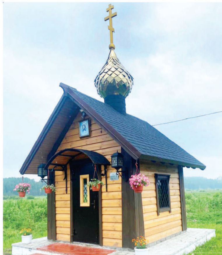
Часовня в микрорайоне Заболотная «Казанской божьей матери» всегда открыта для прихожан

- «Петровский мясной дом» - это новое предприятие, молодое. И коллектив наш здесь тоже молодой. За девять лет мы все сдружились так, что стали одной большой семьей.