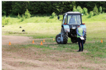
Конкурсные испытания с окружного конкурса в Юсьве.