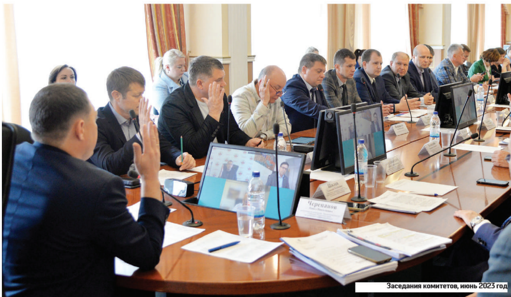
Заседания комитетов, июнь 2023 год

По данным ГУ МВД по Пермскому краю, в прошлом году продолжилось снижение преступности среди несовершеннолетних (с 774 до 633 случаев). Среди этих случаев преобладают преступления имущественной направленности, 51,8 % составляют кражи. Также