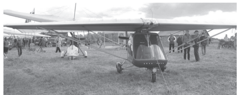
В течение дней соревнований зрители могли вблизи посмотреть на летательные аппараты. И даже посидеть за штурвалом