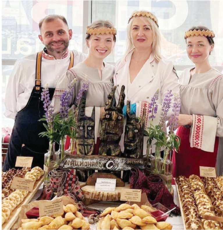
Всегда на высоте. Краевое обслуживание