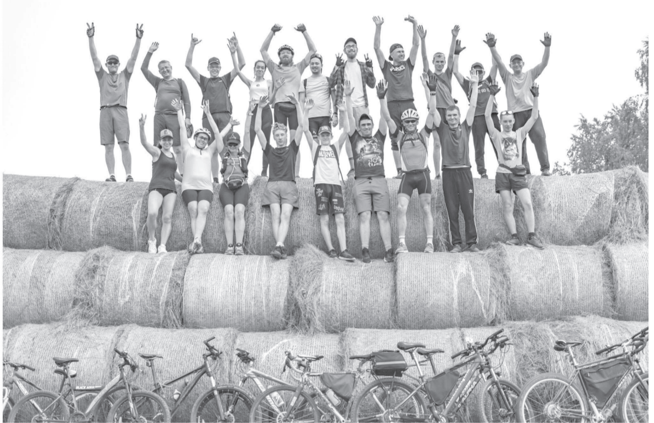
Активисты «ВелоКудымкара» – дружные, всегда вместе, веселые и хорошие ребята

...Вот сразу пришел на ум фильм-хоррор «Поворот не туда». Перед глазами побежали сразу картинки, явные и неявные. Стоп-кадр! А с ним и мысли! Фантазия через край! Внимание, спойлер - все велосипедисты марш-броска в 50 километров вернулись целыми и невредимыми! Мало того – еще окрыленными и влюбленными в природу Коми округа. Так, 28 мая, в Кудымкаре стартовало Велолето. Велюбители города открыли летний Велосезон-2023.