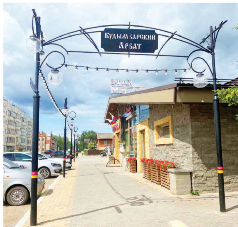
Новый проект «Кудымкарский арбат», открыт к 30-летию торговой сети