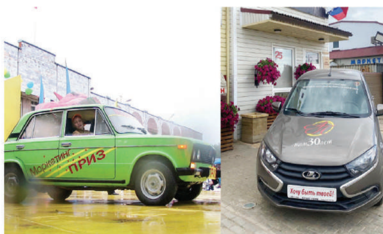
Розыгрыш машины ВАЗ-2106 12.06.2005 года и розыгрыш машины Лада Гранта 8.07.2023 года