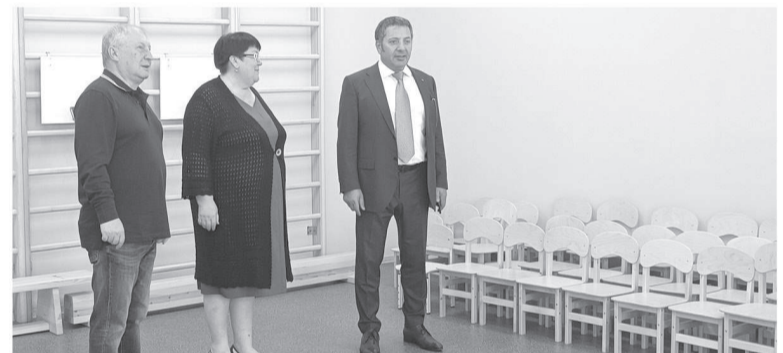
Уже в сентябре новый детский сад в Малой Серве распахнет двери для малышей, депутат отметил, что в детском саду созданы все условия для всестороннего развития детей