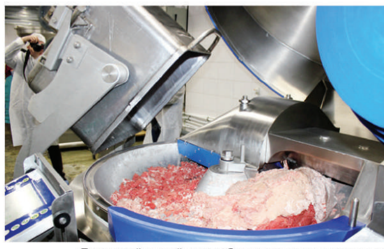
«Петровский мясной дом» работает только на современном оборудовании