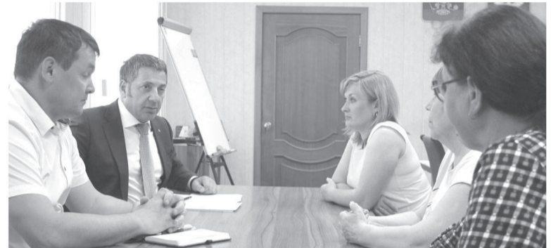
В рамках недели приемов, посвященных материнству и детству, Вагаршак Сарксян рассмотрел пять проблемных вопросов. На фото - делегация из Майкора, люди обеспокоены нехваткой врачей