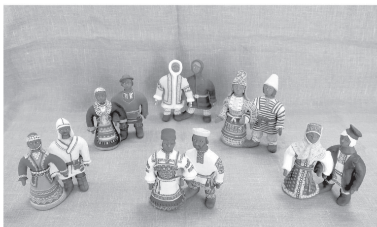
Изделия из глины - конкурсные работы.