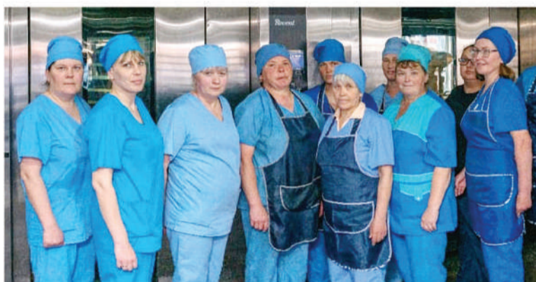
Рабочая обстановка пекарни новая мельница