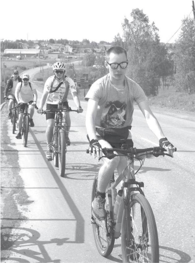
Велюбители покоряют «асфальт», «грунт» и полевые дороги