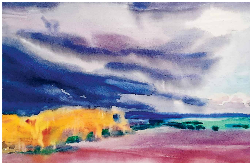
◀ Последняя осень. Бумага, акварель, 1970-е годы.