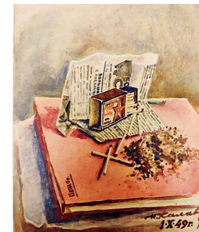
▼ Натюрморт со спичками. Бумага, акварель, 1949 год.