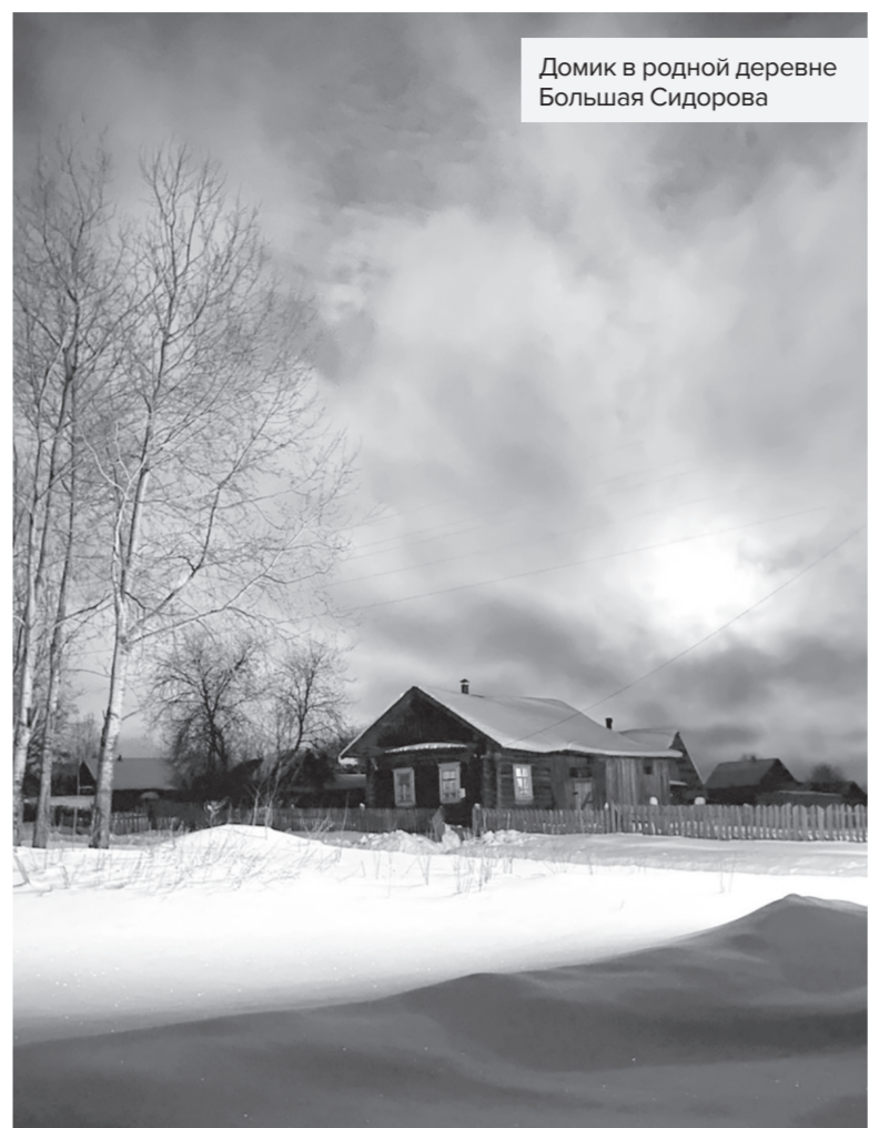
Домик в родной деревне Большая Сидорова