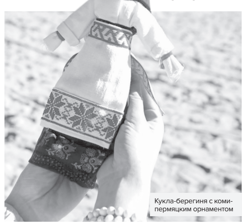
Кукла-берегиня с коми-пермяцким орнаментом

в былые годы стеснялась своего происхождения, и даже скрывала его. Теперь всё иначе, ведь о коми-пермяках начали говорить и даже снимать кино.