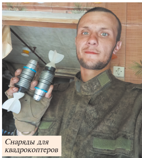
Снаряды для квадрокоптеров