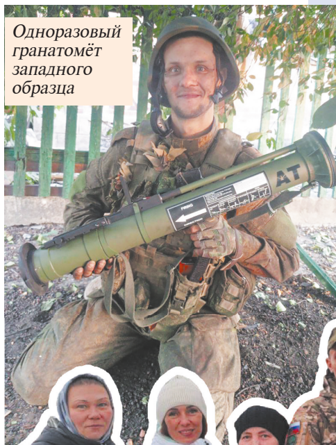
Одноразовый гранатомёт западного образца