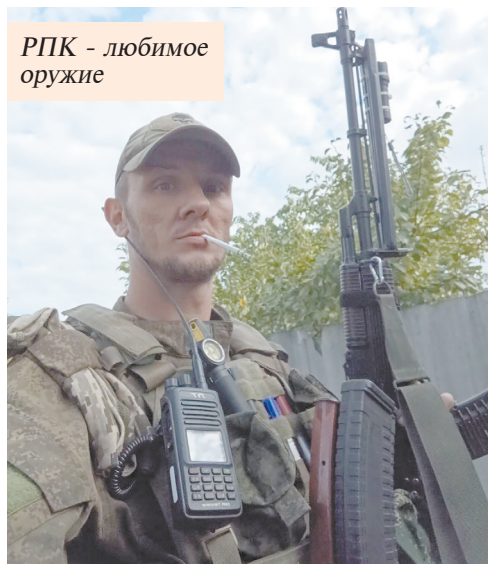
РПК - любимое оружие