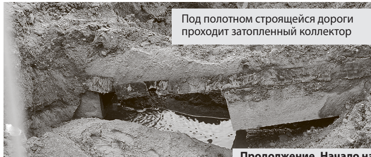
Под полотном строящейся дороги проходит затопленный коллектор