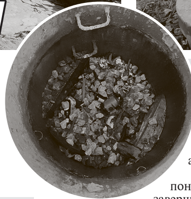
Нечто похожее на колодец ливневой канализации. Вид внутри