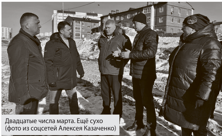
Двадцатые числа марта. Ещё сухо