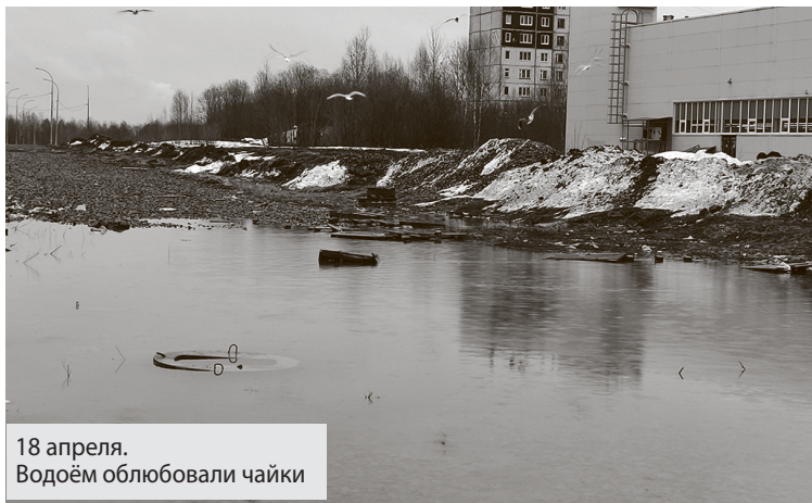
18 апреля. Водоём облюбовали чайки