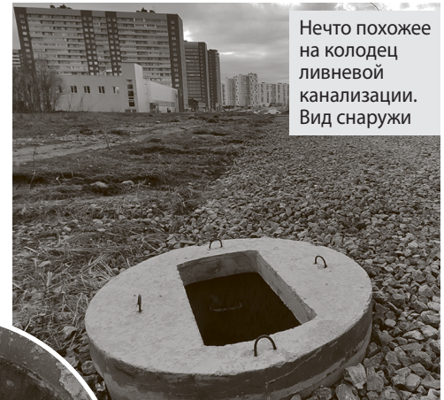
Нечто похожее на колодец ливневой канализации. Вид снаружи

Предыдущие подрядчики обычно сдавались на моменте, когда пытались работать с коммуникациями, которых по траектории трассы немало. Особенно сложно было с ливневой канализацией. Несмотря на все попытки её обустроить, результат оказывался одинаковым: участок будущей дороги в месте примыкания к улице Дошеникова (как раз тот, где дети зимой гоняют с самостийной горки) оставался огромной лужей. Особенно впечатляющей по размерам после сильных ливней и таяния снега.