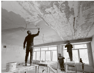
Ноябрь 2024 года. Подрядчик с натугой, но ещё укладывается в сроки