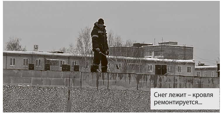
Снег лежит – кровля ремонтируется...

В середине июня тональность вопросов разумных горожан о судьбе ремонта становится всё жёстче: почему ничего не было предпринято, когда сроки были фактически сорваны, и зачем было прикрывать этот факт бравадными надеждами.