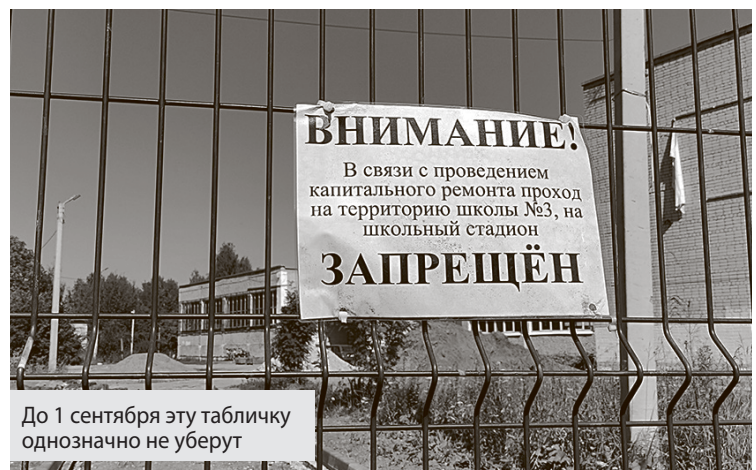
До 1 сентября эту табличку однозначно не уберут