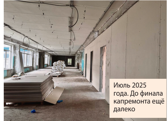
Июль 2025 года. До финала капремонта ещё далеко