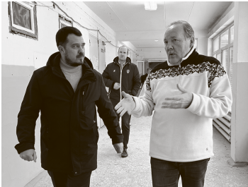
Осень 2024 года. Ещё ничего не предвещает больших проблем. Ну, кроме репутации подрядной организации

Блокировка банковских счетов? ✓ Нет сведений о приостановке операций по счетам на 17 июля 2025 года Проверить на сегодня