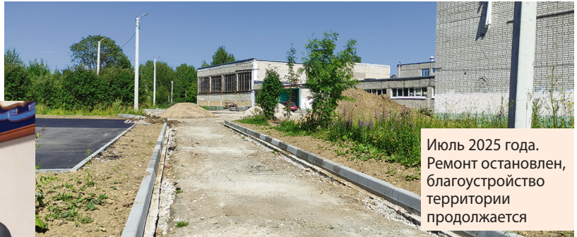
Июль 2025 года. Ремонт остановлен, благоустройство территории продолжается