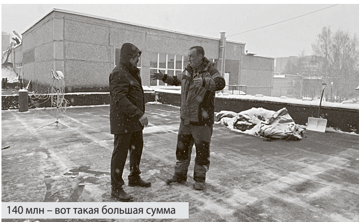
140 млн – вот такая большая сумма

Томную летнюю тишину информационного поля Березников всколыхнуло внезапное видеообращение главы города Алексея Казаченко по ситуации с капремонтом школы №3. Ситуация, на первый взгляд, так себе. Но обычно мэр внепланово (вне заранее объявленных прямых эфиров) обращается к горожанам или для приглашений на праздник, или в случае крупных аварий. Причём тут школа? И почему мэр выглядел очень расстроенным?