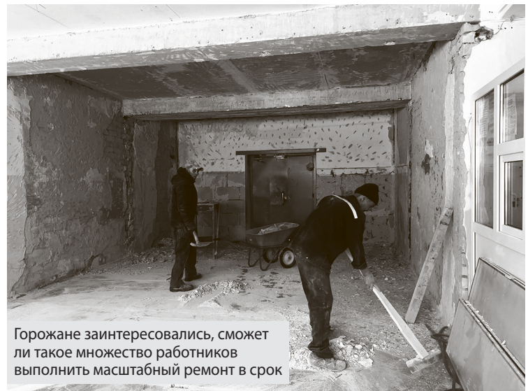
Горожане заинтересовались, сможет ли такое множество работников выполнить масштабный ремонт в срок