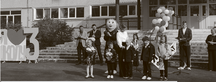
Сентябрь 2024 года. Ученики школы №3 встречают начало учебного года в корпусе бывшей школы №10