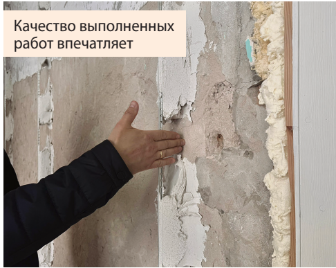
Качество выполненных работ впечатляет