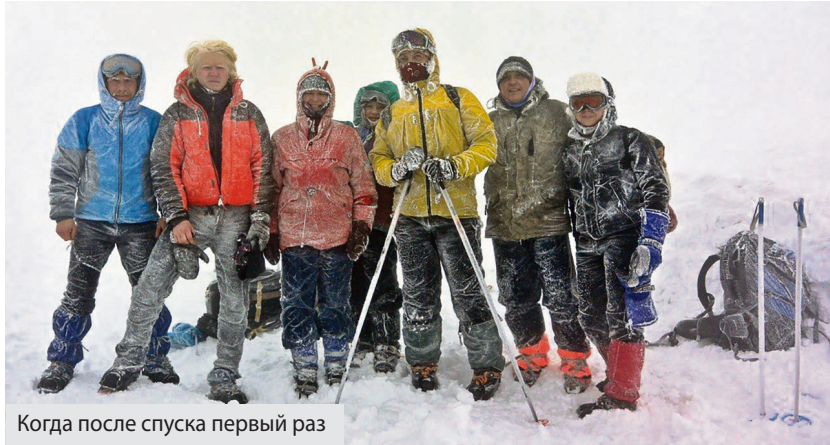
Когда после спуска первый раз встали на ноги