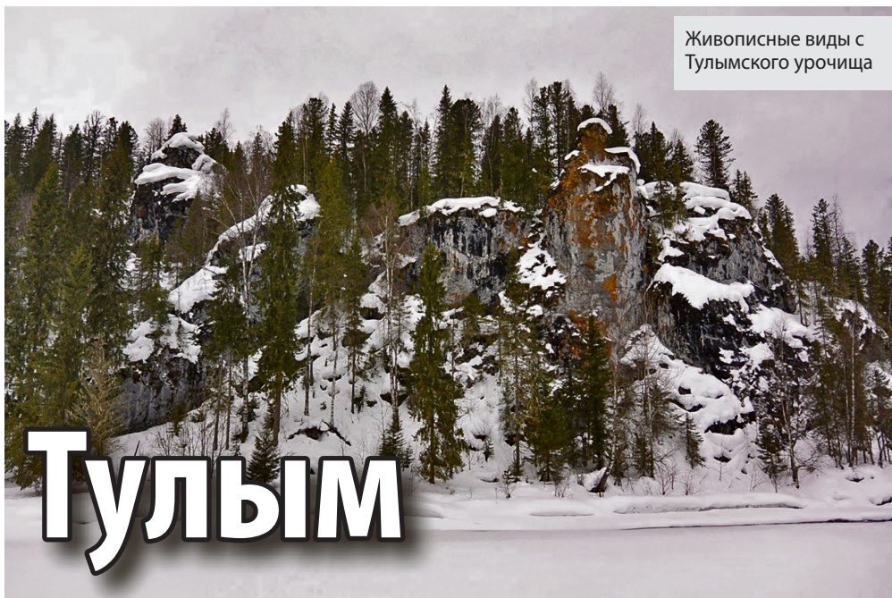
Живописные виды с Тулумского урочища

Зима в этом году не задалась. Тёплая слишком была. Все ручьи в лесу бежали до конца февраля, лёд на реках стоял не очень уверенно. К началу марта 2025 года в Пермском крае подморозило. Речки, где бежали – встали. И мы попросились в заповедник попробовать проложить снегоходную дорожку под самым Тулумским камнем, а также что-нибудь нужное сделать. Ведь из-за плохой зимы и инспектора тоже не могли подняться по реке. А снега-то было очень много. Все крыши завалены. Того гляди крыши