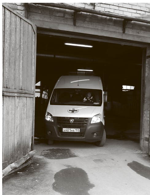
12-часовая смена бригады скорой помощи, особенно днем, очень напряженная

Во вторник 15 июля рано утром на станцию скорой помощи приехала делегация от краевого минздрава, состоялся обстоятельный разговор с коллективом водителей при участии руководства станции. Министерские представители сообщили, что нашли недочеты в работе экономиста «скорой помощи», что какие-то не дошедшие до работников доплаты должны быть возвращены. Попросили водителей повременить месяц, пообещали во всем разобраться и вернуть зарплаты на уровень мая. Коллектив согласился подождать. Следующее совещание с министерскими посланниками пройдет в первой декаде августа.