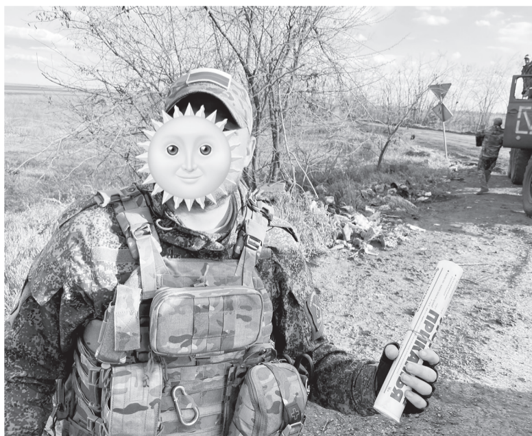
Районка была доставлена бойцам в апреле с гуманитарной помощью от жителей Еловского округа

Мы ждём добрых вестей и возвращения ребят домой живыми и здоровыми. Пожелаем удачи нашему земляку. Победа будет за нами!