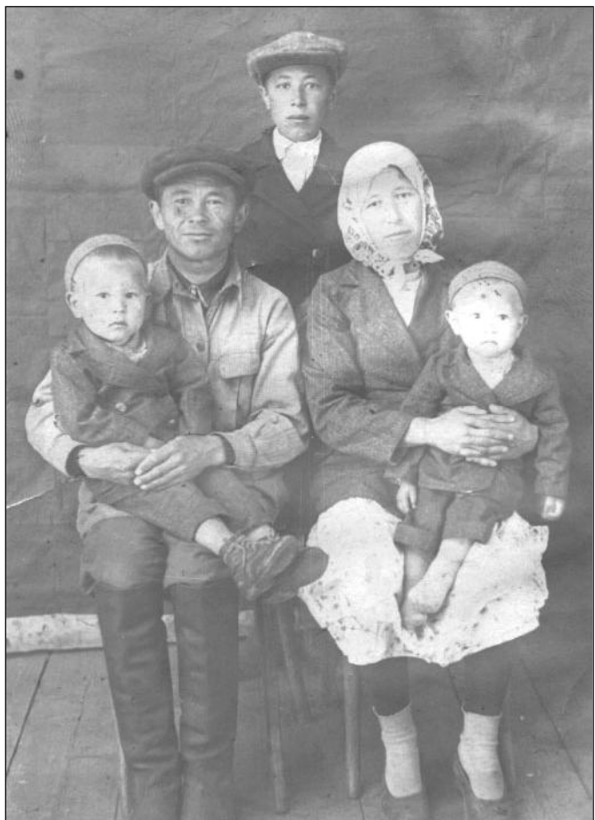
Семья до начала войны. Начало июня 1941 г.