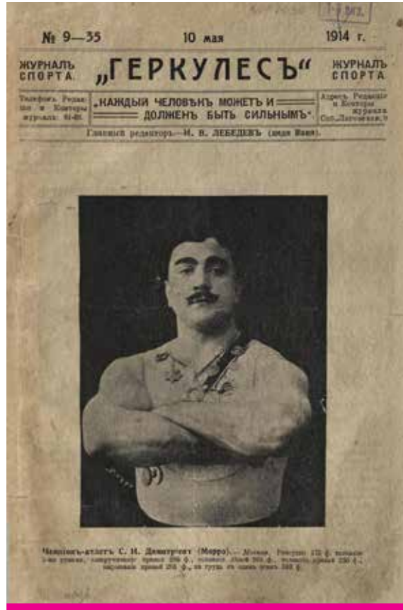
Журнал Геркулес, 1914, № 9-35 (10 мая), в котором вышел рассказ Грина «И для меня придёт весна».

Александр Грин, «Человек человеку» (12+), 1913 г.