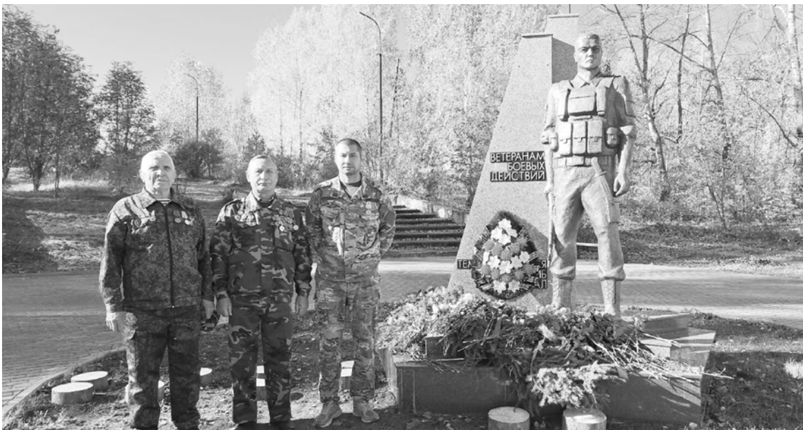
На открытии памятника ветеранам боевых действий в г.Оханске.