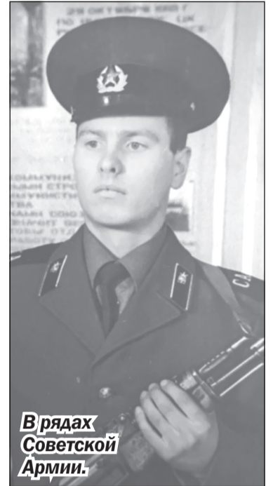
В рядах Советской Армии.

И всё-таки что-то в нём надломилось. Хотя на поведение учителя не жаловались, не стало в нём прежнего рвения в учёбе, возникли проблемы с прилежанием. Ему нравилось проводить время дома, лёжа на диване и чи-