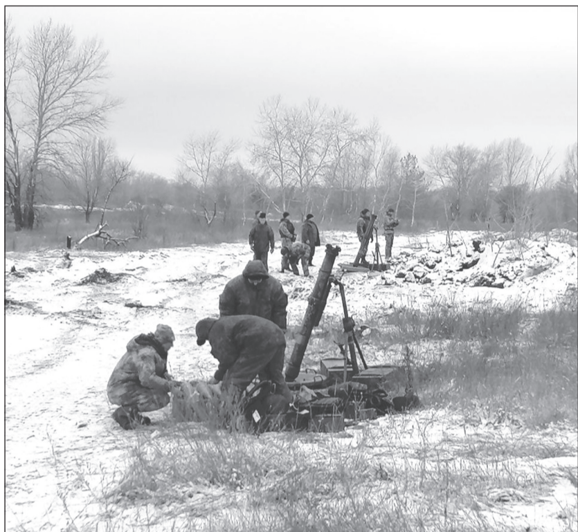
Работает миномётный взвод.