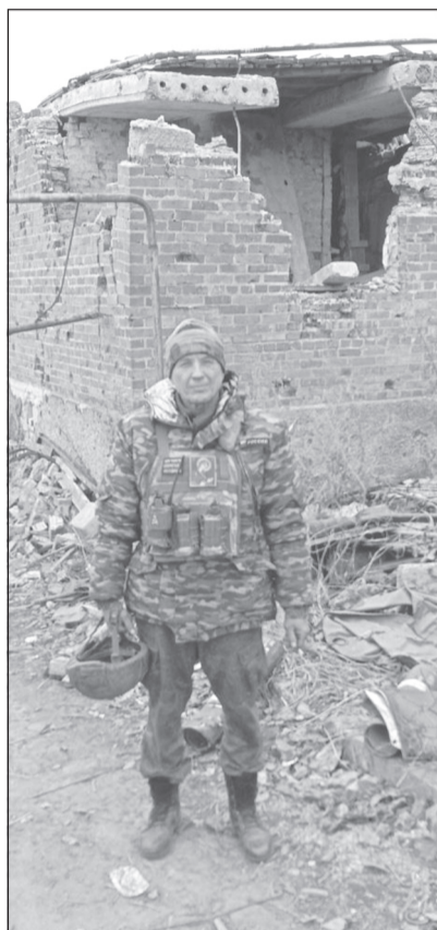
Командир миномётного расчёта с позывным «Черняк».

Продолжение. «Начало — на 14-й странице».